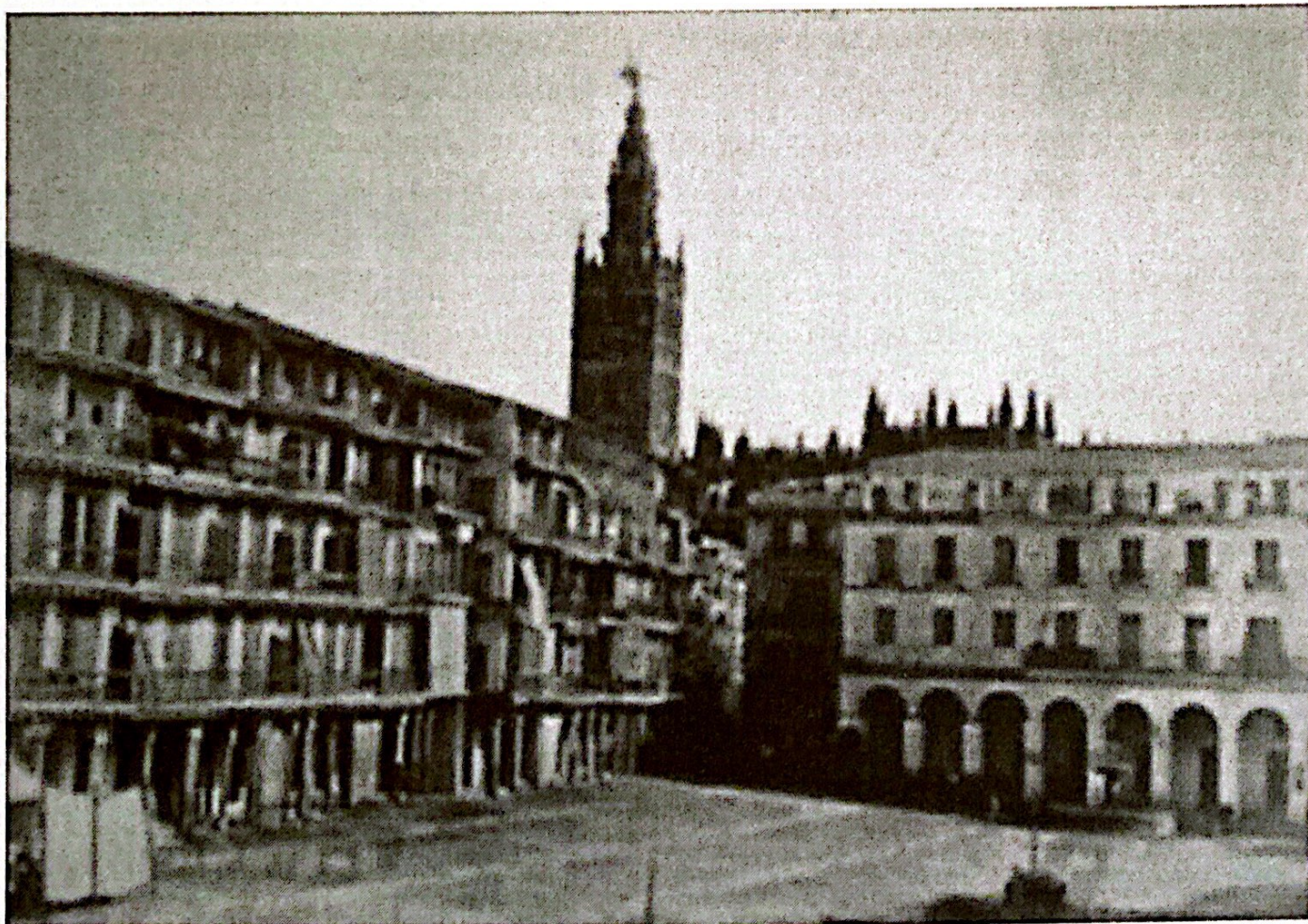
Ch. Clifford, Plaza de San Francisco , h. 1862, fotografía.

Y todo eso fue lo que atrajo a los primeros viajeros a Sevilla a comienzos de siglo XIX. Los soldados franceses, que vinieron con Napoleón a conquistar España, sacaron de los conventos y las