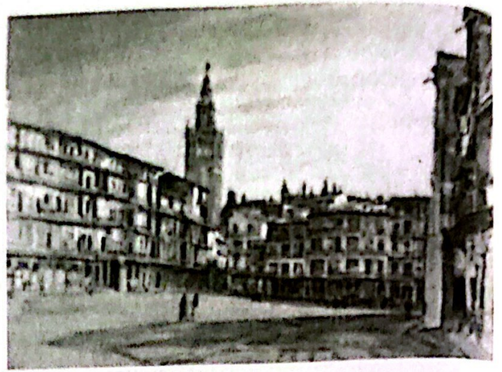
J. F. Lewis, Plaza de San Francisco , h. 1833, aguada.

La imagen romántica (la imagen) de Sevilla se crea y se difunde casi simultáneamente en pintura y en fotografía. Los cuadros y los dibujos de la ciudad empiezan en los años treinta. Los ingleses Richard Ford (1832), su amigo John Frederic Lewis (1833), el escocés David Roberts (1833) y el gallego Jenaro Pérez Villamil (1833), los franceses Delacroix (1832), Pharamond Blanchard y Adrien Dauzats (1833-1837), el maestro sevillano José Bécquer (1805-1841, padre del poeta Gustavo Adolfo y el