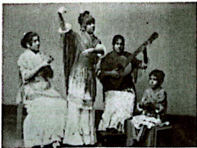
R. P. Napper, Gitanos , h. 1863, fotografía.

R. P. Napper estuvo en España a finales de los años cincuenta y publicó un álbum con vistas de Andalucía, la mitad de las cuales eran de Sevilla y una de San Telmo. Napper vendió a Montpensier su volumen Views in Wales. The Vale