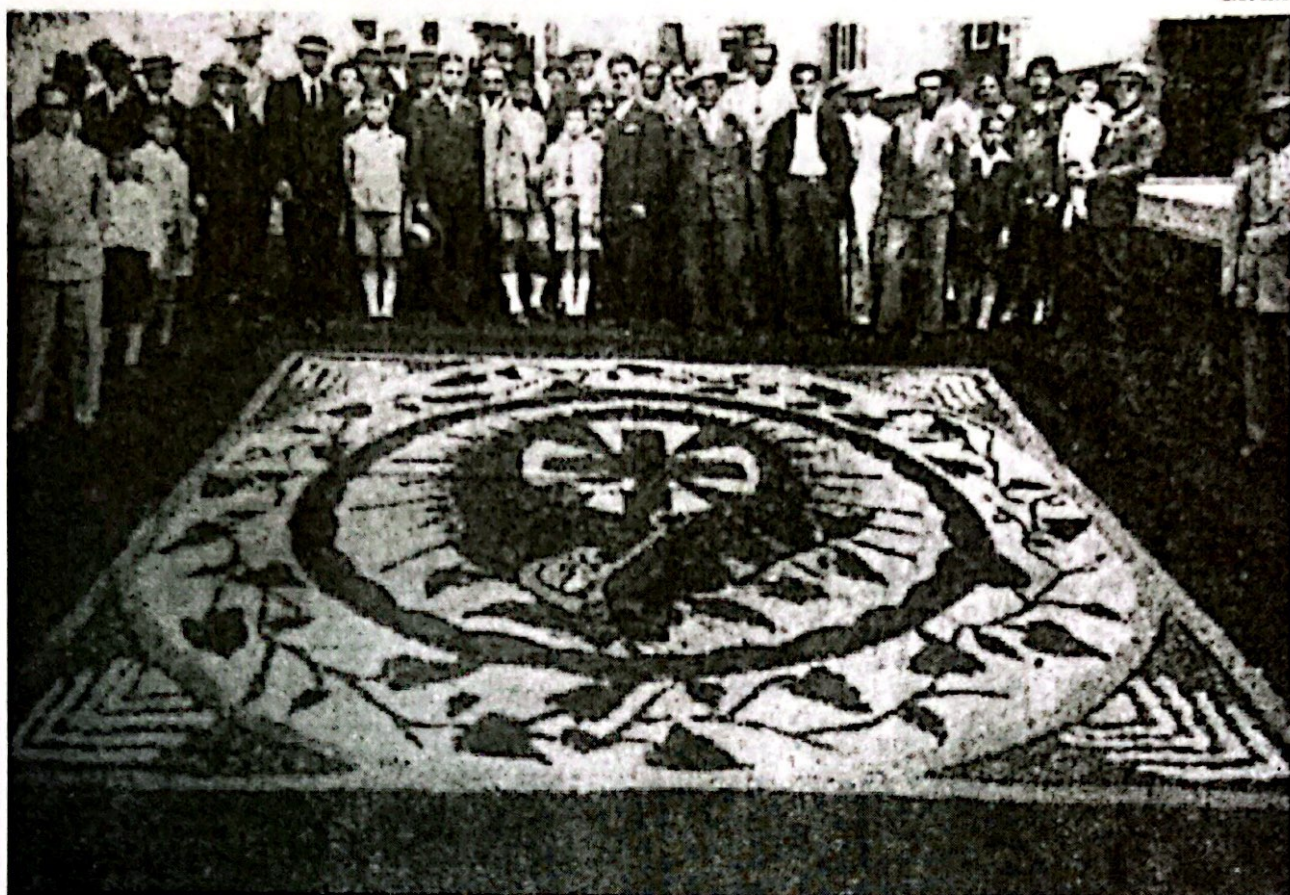
1930 Alfombra en la calle.