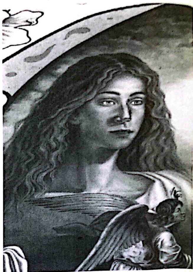
Detalle de la Plaza, 1998.