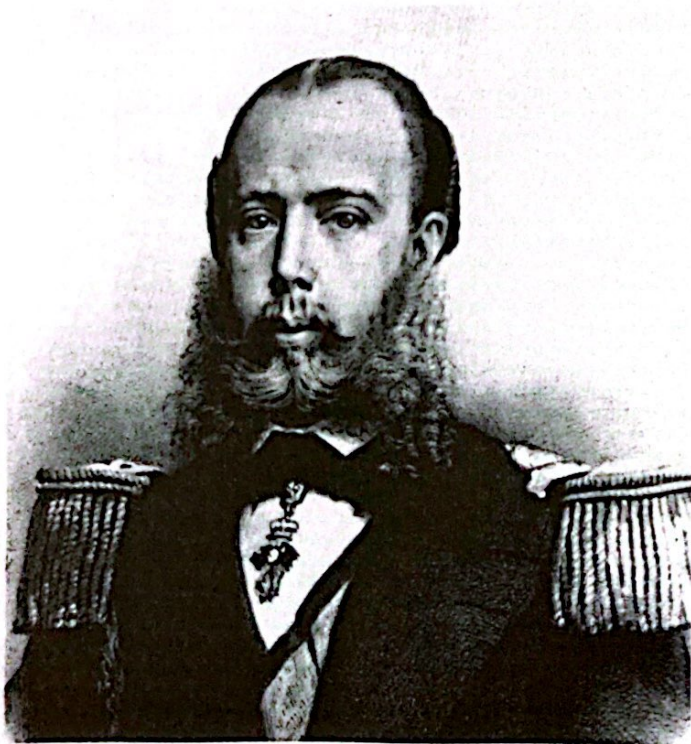
El archiduque Maximiliano, hermano del emperador austríaco Francisco José I., fue comandante en jefe de la Marina austro-húngara.