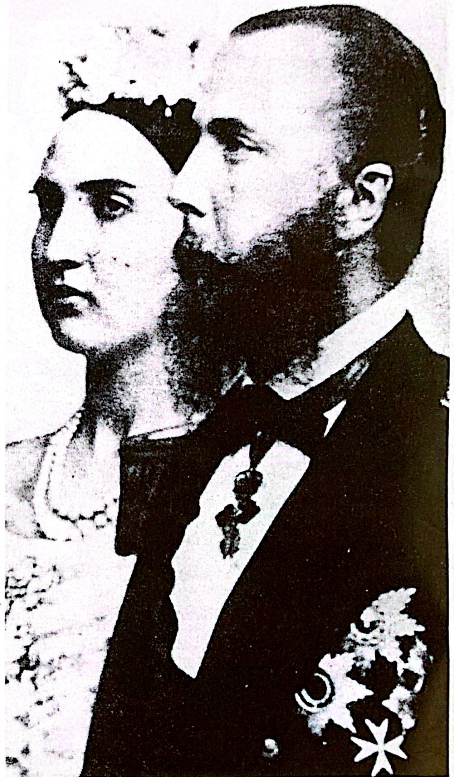
Maximiliano de Austria, el que más tarde sería emperador de Méjico y su esposa Carlota de Bélgica.

En el momento de la despedida, de uno de los bultos del equipaje se cayó una pequeña placa de metal, en la cual estaba grabado, sin embargo, archiduque Ferdinand Max. El joven noble se la regaló generosa-