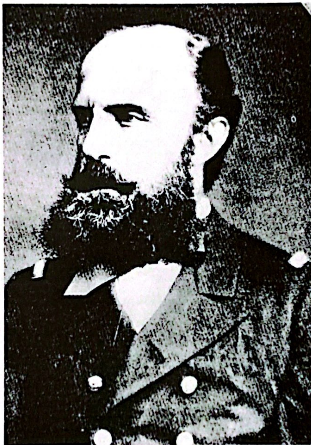
El ayudante del archiduque Maximiliano, capitán de corbeta Wilhelm Tegetthoff, se convirtió más tarde en "el héroe de la Marina austriaca".