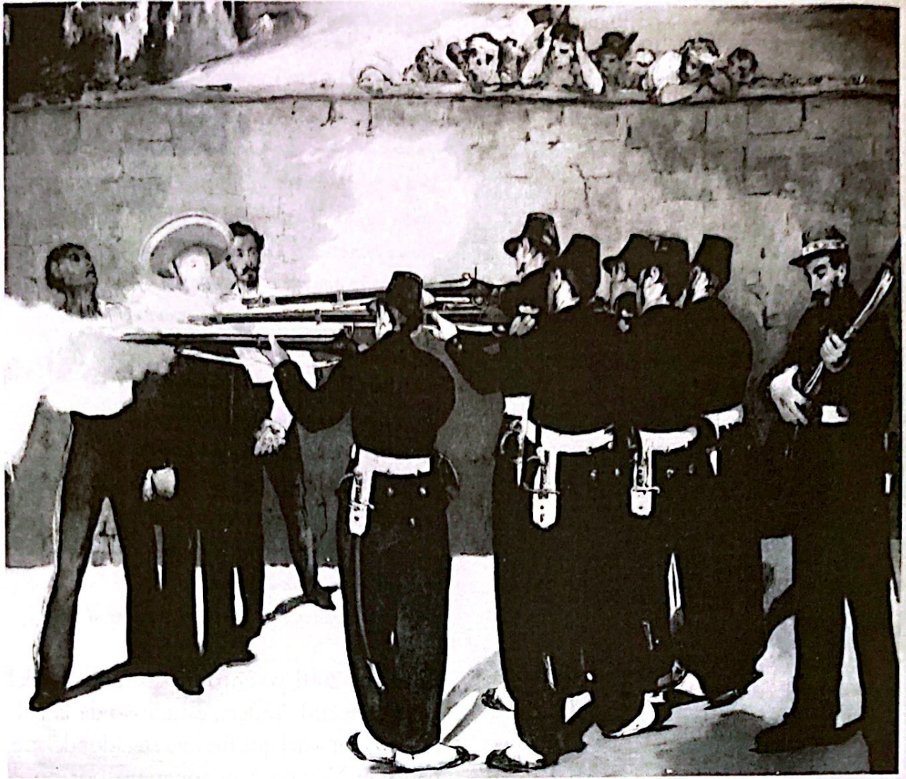
El fusilamiento de Maximiliano de Méjico en Querétaro. (Óleo de Eduardo Manet)