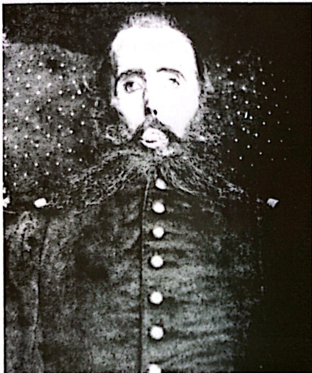
Al cadáver momificado de Maximiliano se le colocaron los ojos de cristal de la figura de un Santo.