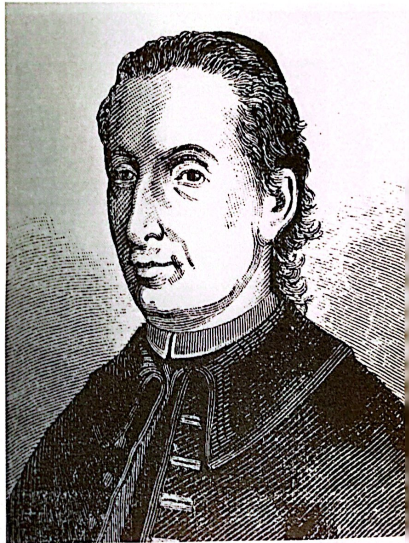
José de Viera y Clavijo.

ron las islas a lo largo de ese siglo. El sistema de denominación de las especies desarrollado por Linneo, permitía la identificación o descripción de nuevas especies, dentro de un marco relativamente ordenado. Sin embargo, las aportaciones realizadas por Linneo sobre las algas marinas fueron bastante limitadas, de tal manera que en los primeros años del siglo XIX aún reinaba una gran confusión, no sólo con respecto a las algas marinas, sino al resto de las plantas criptógamas (hongos, líquenes y musgos). En Canarias, los conocimientos sobre estos organismos prácticamente se limitaban al líquen denominado 'orchilla', utilizado en la industria de los tintes y que había sido objeto de intenso comercio después de la conquista.