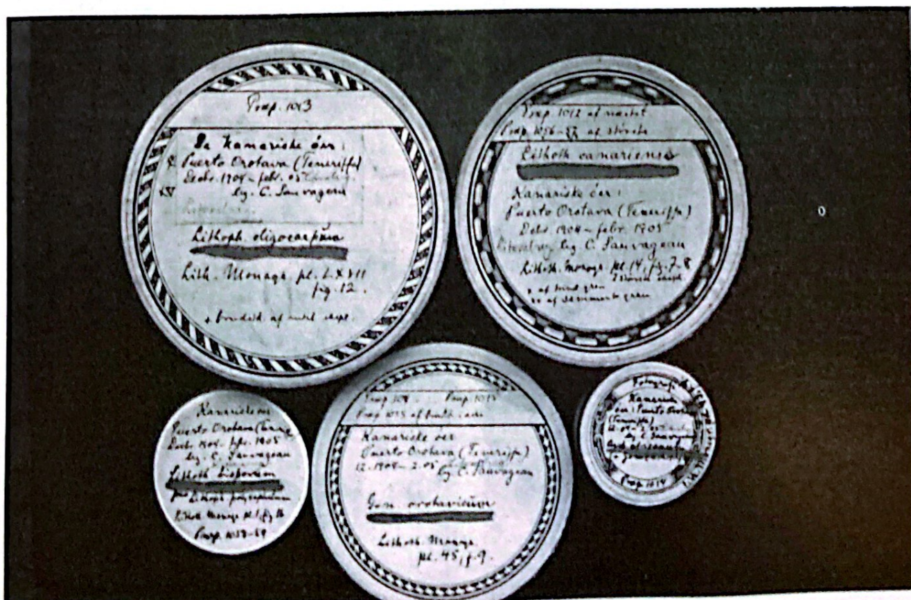
Cajas del Herbario Foslie (Trondheim, Noruega) que incluyen el material tipo de algas de Puerto de la Cruz.

de Historia Natural de París 12 . Entre las observaciones documentadas por este