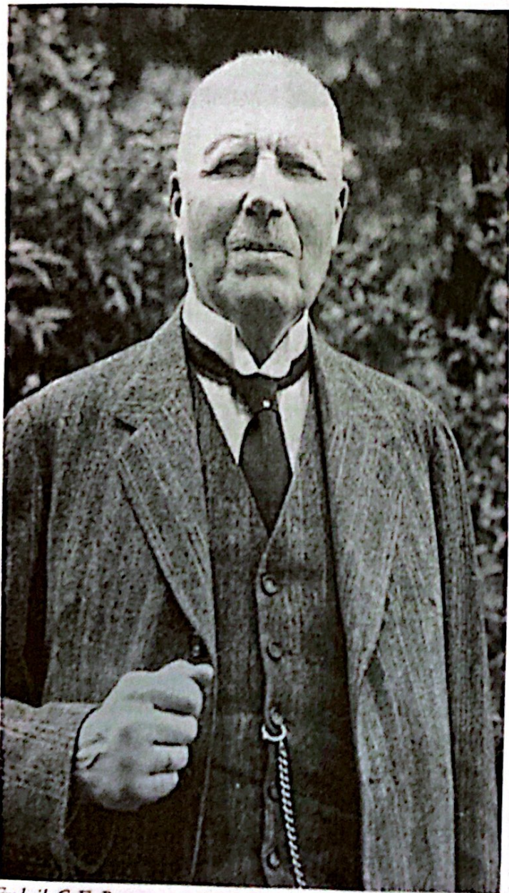
Frederik C. E. Borgesen

científico tienen particular interés las realizadas en las algas pardas del género Cystoseira , que eran bastante comunes y relativamente fáciles de reconocer entre otros atributos por su característico color pardo amarillento. Así, a una de estas especies, hasta hace pocos años muy abundante en las aguas someras y que era arrojada en grandes cantidades a las playas después de los temporales, se debe el topónimo 'baja amarilla'. Entre los descubrimientos realizados por Sauvageau en Puerto de la Cruz, hay que incluir una de las especies características de los charcos más altos del litoral ( Cystoseira canariensis ahora C. humilis ), así como la forma postrada de Lobophora variegata ( Aglaozonia canariensis ).