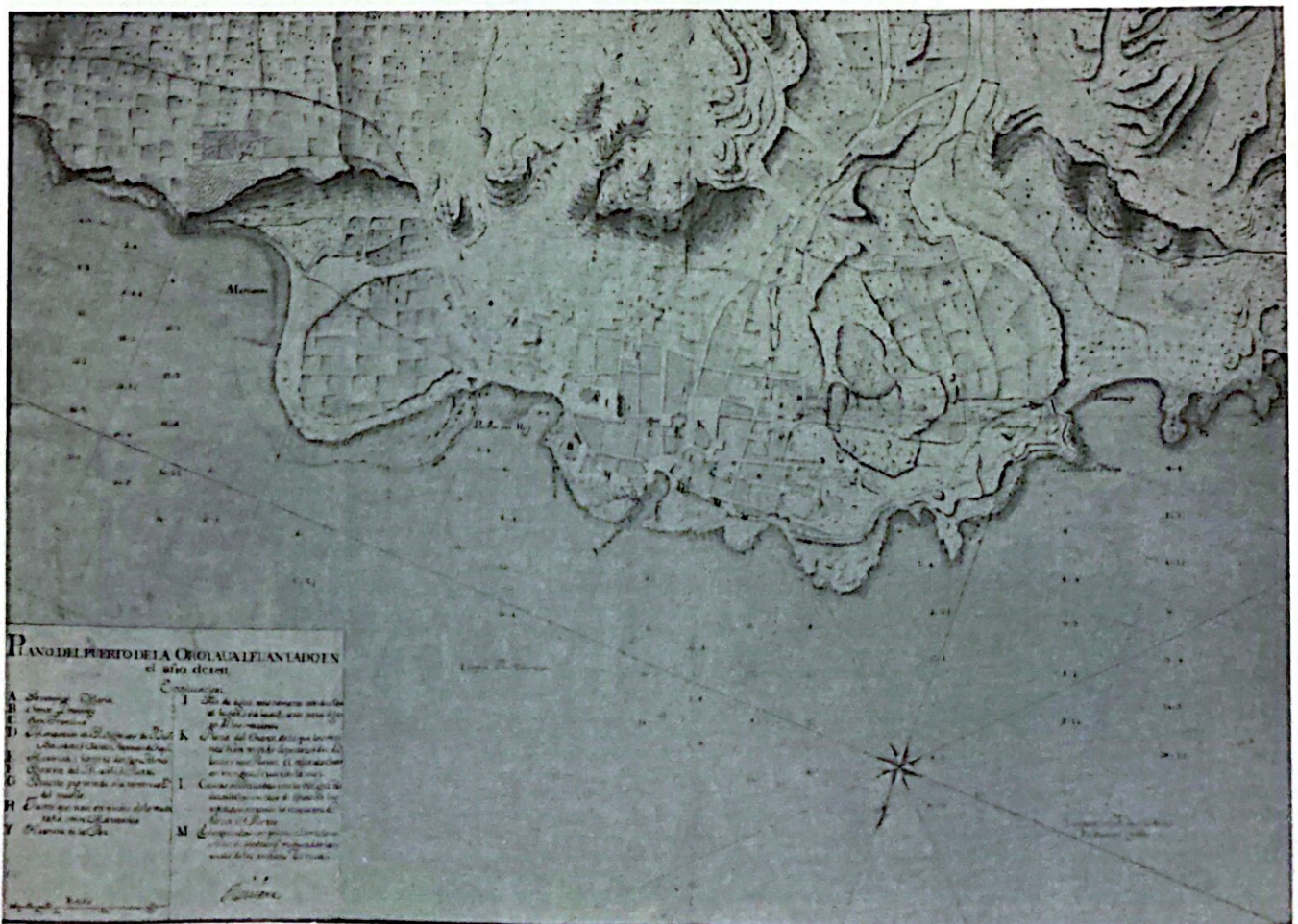
Plano de Puerto de la Cruz de A. Riviere 1741.

realizar un análisis exclusivamente del componente de naturaleza vegetal que formaba parte de estos ecosistemas litorales. En el presente es posible comprobar que restos de esta riqueza biológica todavía pueden ser reconocidos. Para la valoración objetiva de estos ambientes, intentaré en todo caso, separar el entusiasmo propio de mi condición de botánico marino, de mi pasión como portuense por el estudio del patri-