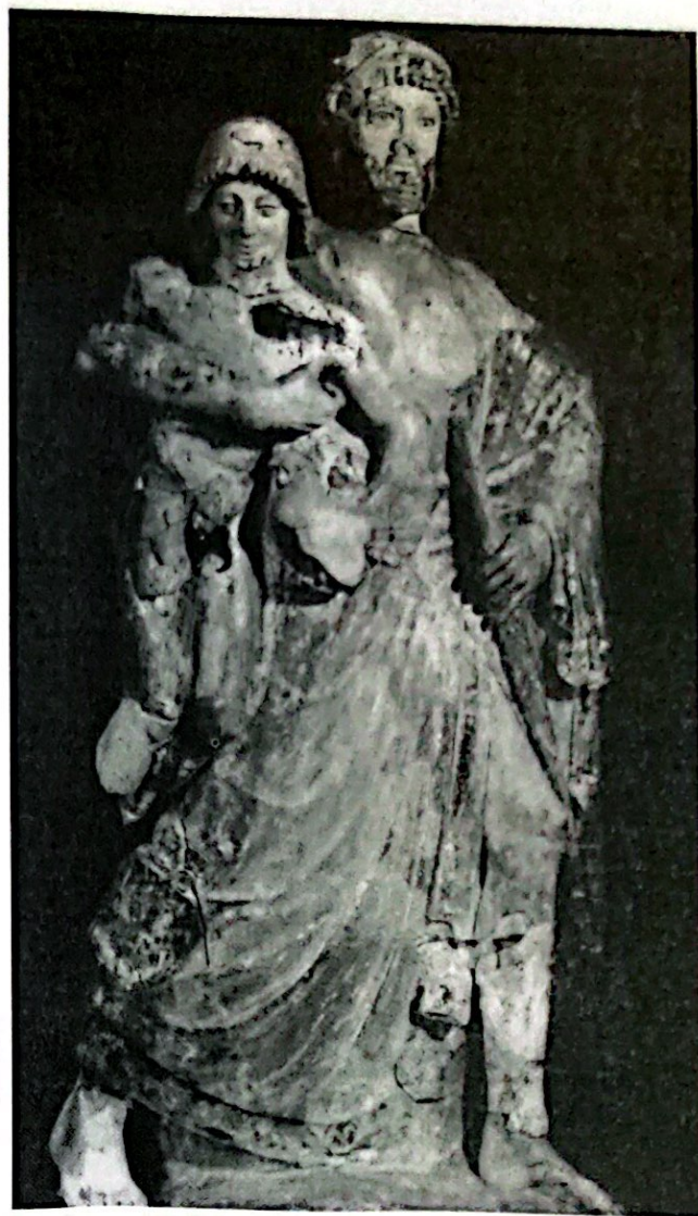
Zeus raptando a Ganimedes. Museo de Olimpia.

5.2.- Alonso de Espinosa.- En su obra Del Origen y Milagros de la Santa Imagen de Nuestra Señora de Candelaria , de 1594, A. de Espinosa se hará también eco de los Campos Elisios al recordar el texto de Plutarco sobre Sertorio, con estas palabras: Hay noticias destas islas, aunque no de todas, desde antes del nacimiento de Cristo, nuestro Redentor. Porque Plutarco en la vida de Sertorio, capitán romano, que fue cincuenta años antes del nacimiento de Cristo, hace memoria de algunas dellas, que no son las mejores, y dice así: «Estando Sertorio en Cádiz, huido de los romanos que le habían quitado su plaza, llegaron a él unos marineros que acaso entonces tornaban de las islas Atlánticas que llaman Bienaventuradas». Y, después de haber contado el sitio de ellas, dice: «Hay en ellas pocas lluvias, y vientos medianos, y por la mayor parte suaves con su rocío. El suelo dellas es grueso, y no solamente es fácil de labrar, arar y plantar, mas aún de sí, sin algún estudio [esfuerzo] humano, produce fruto dulce y bastante para mantener muchedumbre ociosa. El aire es allí sencillo y templado, y guarda por tiempos mediana templanza, porque los vientos que