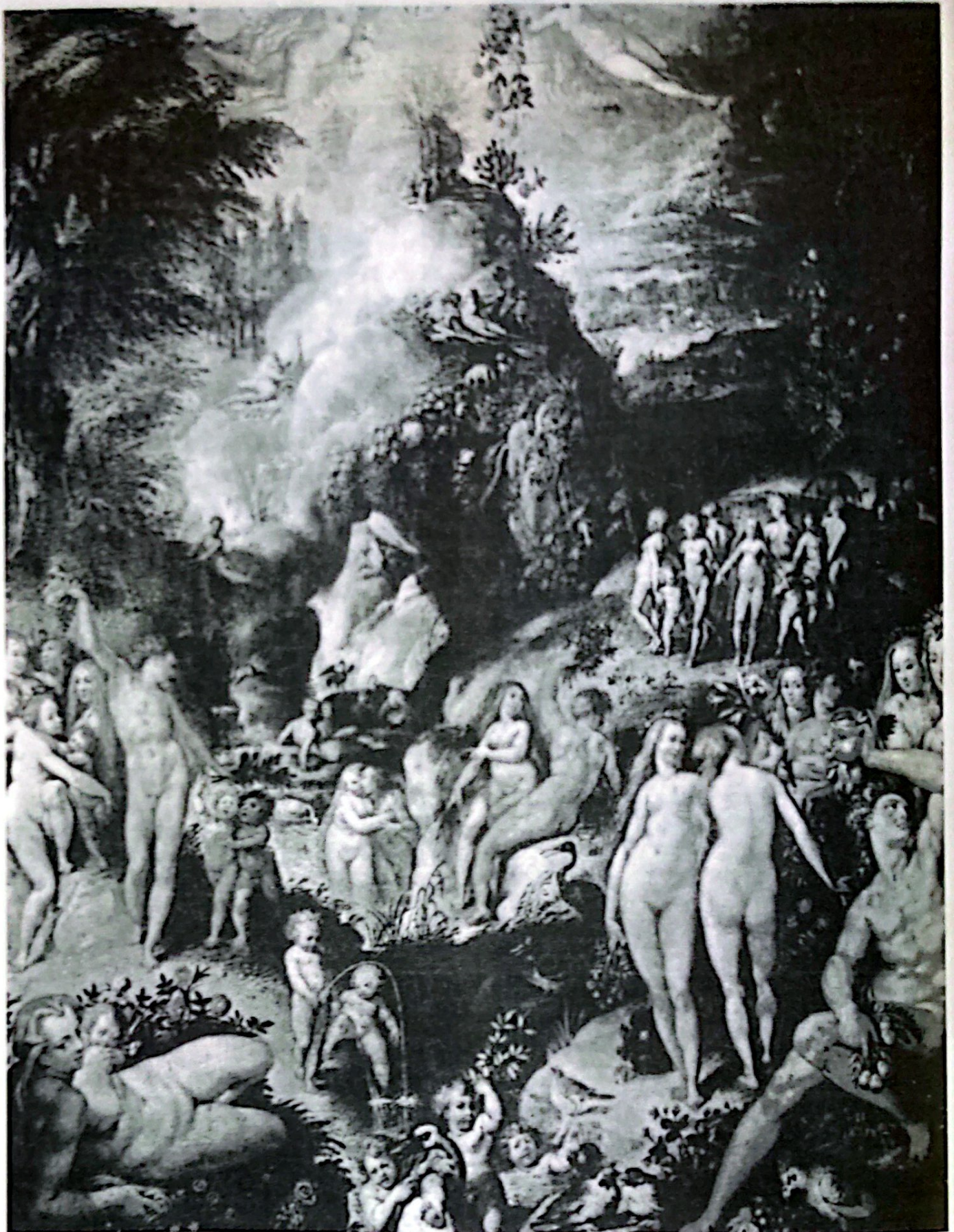
Edad de Oro, I. Zucchi.

En los minutos de la arena creo sentir el tiempo cósmico: la historia que encierra en sus espejos la memoria o que ha disuelto el mágico Leteo. El pilar de humo y el pilar de fuego, Cartago y Roma y su apretada guerra, Simón Mago, los siete pies de tierra que el rey sajón ofrece al rey noruego.