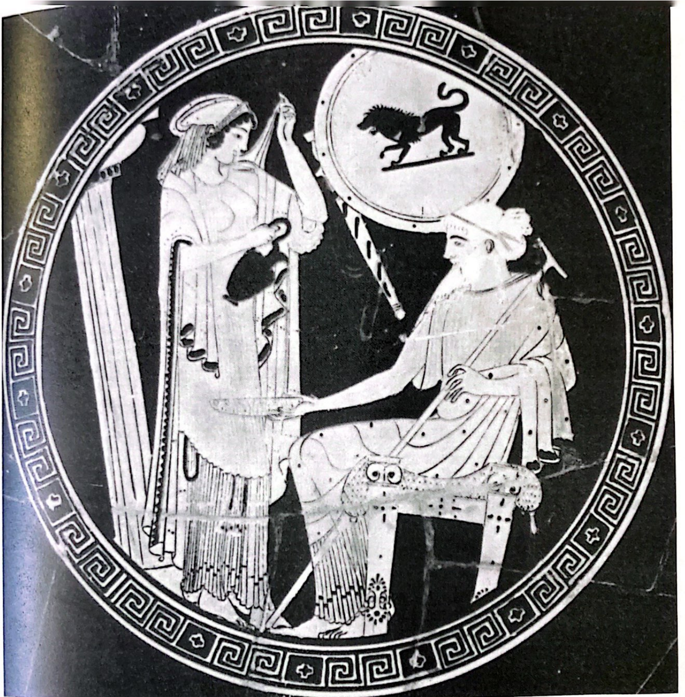
Helena junto a Príamo. Atenas y Esparta.