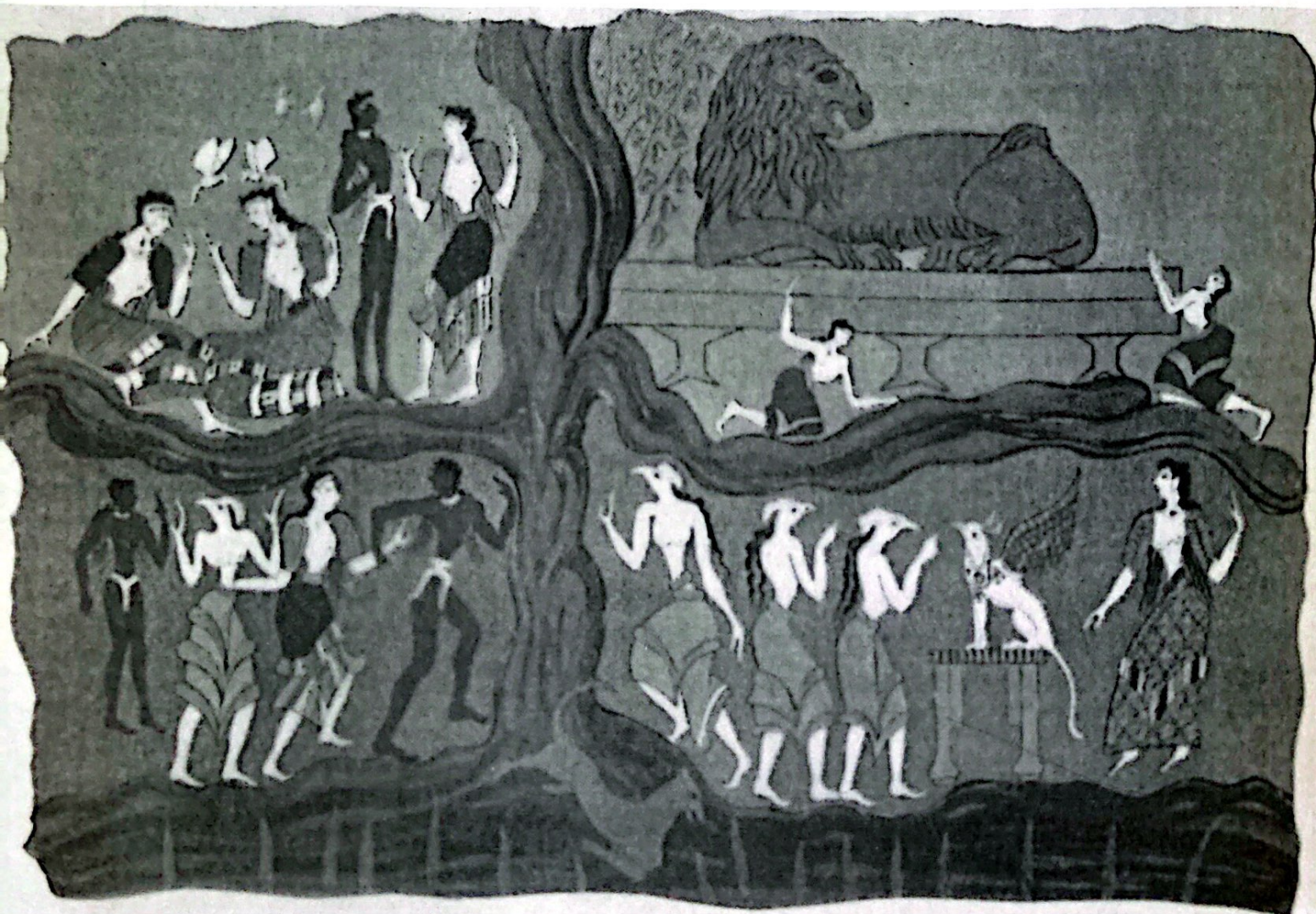
Escena tomada, según Evans, de un fresco del complejo representando la morada de los beatos.

tífico y técnico había invadido Roma y su Imperio; nadie de prestigio creía en los mitos; ya nada se explicaba a través de mitos; los mitos se recreaban en el arte y se usaban en los ritos, y nada más. Todo el Mediterráneo había entrado en una fase de crisis de creencias. ¡Cómo sería aquel tiempo de Roma que se perdió la propia identidad del pueblo romano, porque la República cayó cuando no pudo mantener la esencia de su Estado, encardinada en aquel lema del Senatus Populusque Romanus! Llegó un momento, con Catón y Cicerón, que quienes votaban para nombrar cónsules, no eran ya los romanos, sino los legionarios, mayoritariamente mercenarios, es decir, extranjeros. Y no sólo se perdió la identidad del Estado, sino que se perdió la fe en las tradiciones, en los dioses, en la religión, en las leyes; sólo un nuevo Estado, un nuevo poder, el Imperio, pudo