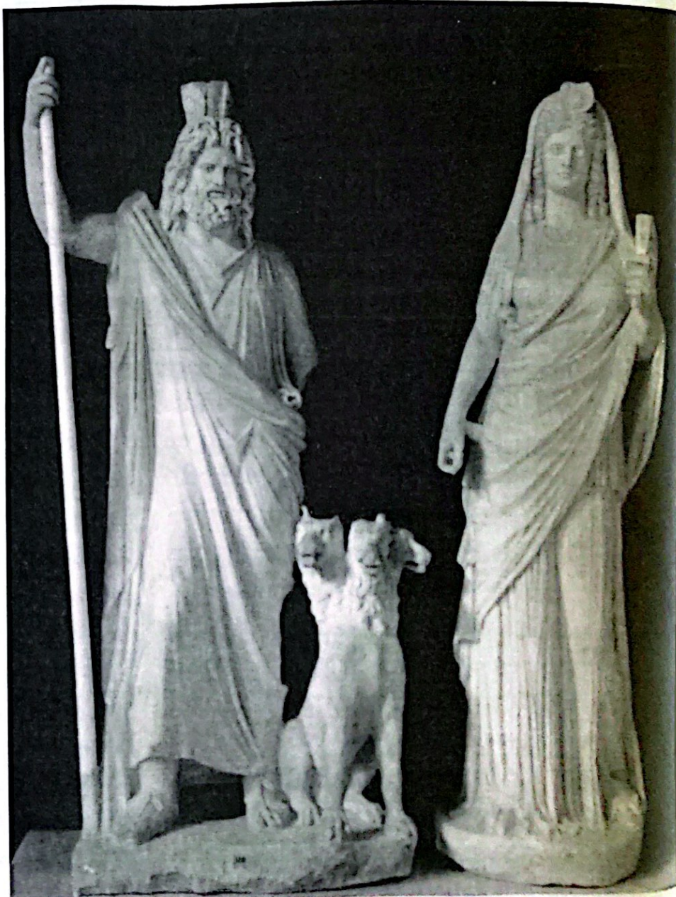
Hades, el Can Cerbero y Perséfone

Quando digo que nuestras islas tuvieron este honor en la fantasía de los gentiles no pretendo desentenderme de las diversas opinio-