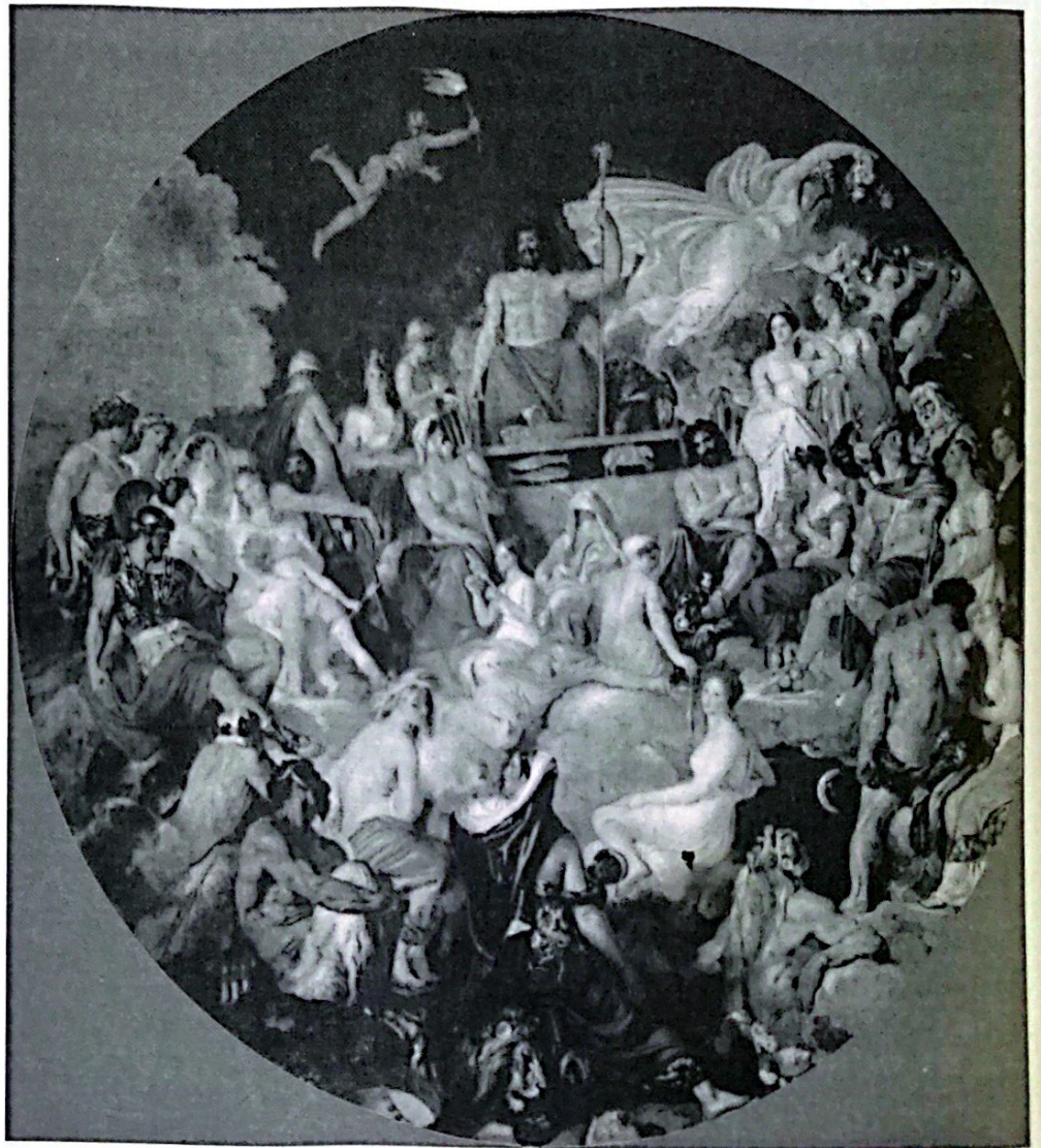
El Olimpo, Luigi Sabatelli.

- Habitan en ella personajes míticos como Radamantis, hijo de Zeus y Europa, vinculado con antiguas tradiciones de Creta que, según algunos, remontarían hasta época minoica y enlazarían con la cultura egipcia 6 . Radamantis era juez de las almas difuntas con Éaco y Minos.