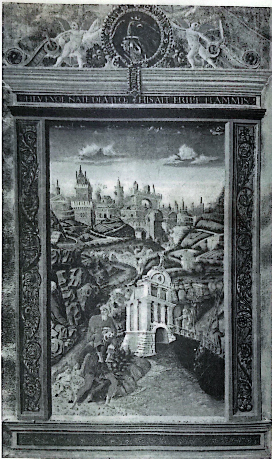
Eneas y Anaquises, al fondo el incendio de Troya.