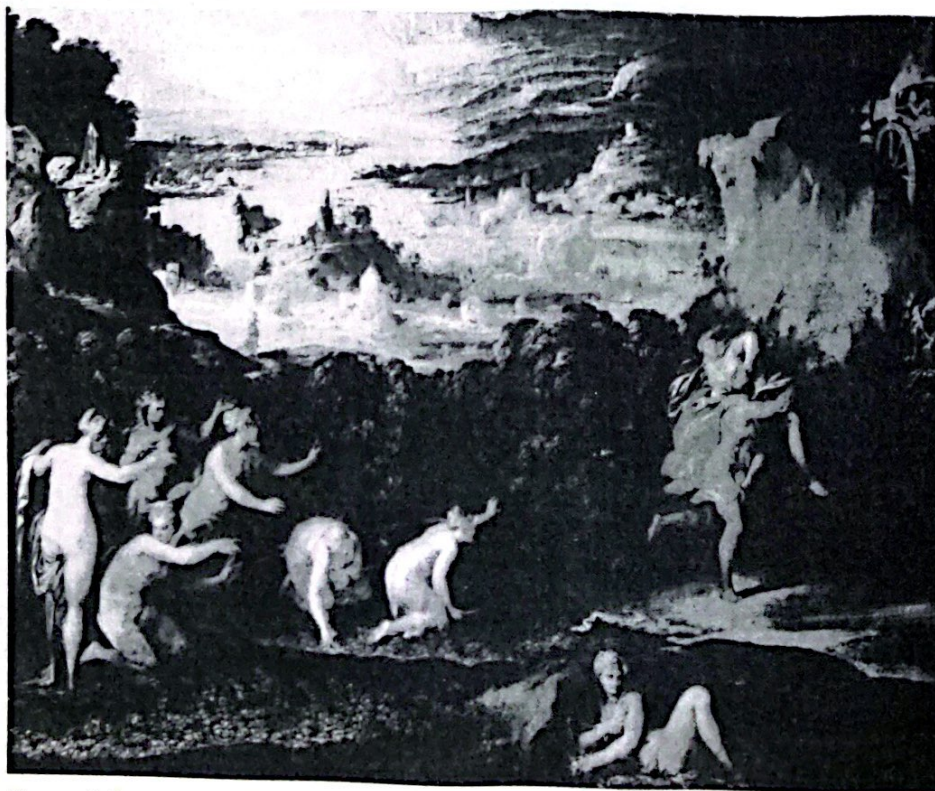
Rapto de Proserpina. Nicollo dell 'Abbate.

2.1.- Muchos son los mitos grecolatinos que aún perviven como mitos en nuestra cultura occidental y muchos de ellos han sido y son fuente de inspiración y recurso para las artes y la Historia. Desde los héroes a los dioses como símbolos de la naturaleza, hasta temas míticos como el «eterno retorno», las fiestas anuales, familiares, públicas o privadas, siguen conservando rasgos de una vieja tradición mítica: Dionisos en el carnaval y el teatro, Apolo y Atenea en la ciencia y arte, Afrodita y Eros en el amor. Mitos como la Atlántida, la caverna, etc. están ahí, en nuestro acervo cultural para cuando queramos echar mano de ellos. Y de