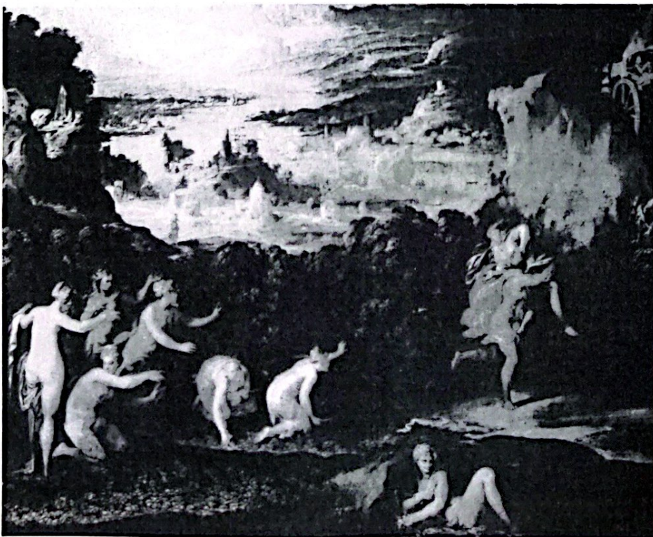
Rapto de Prosérpino. Nicollo dell 'Abbate.

2.1.- Muchos son los mitos grecolatinos que aún perviven como mitos en nuestra cultura occidental y muchos de ellos han sido y son fuente de inspiración y recurso para las artes y la Historia. Desde los héroes a los dioses como símbolos de la naturaleza, hasta temas míticos como el «eterno retorno», las fiestas anuales, familiares, públicas o privadas, siguen conservando rasgos de una vieja tradición mítica: Dionisos en el carnaval y el teatro, Apolo y Atenea en la ciencia y arte, Afrodita y Eros en el amor. Mitos como la Atlántida, la caverna, etc. están ahí, en nuestro acervo cultural para cuando queramos echar mano de ellos. Y de