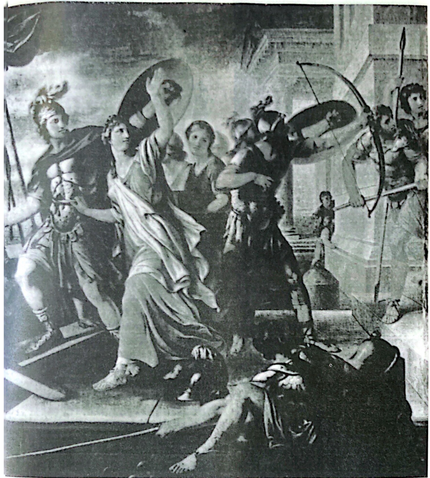
Rapto de Helena, Gavin Hamilton.

sino que además los que están situados más allá de los Sármatas, los que frecuentan el océano glacial y los habitantes de las Islas