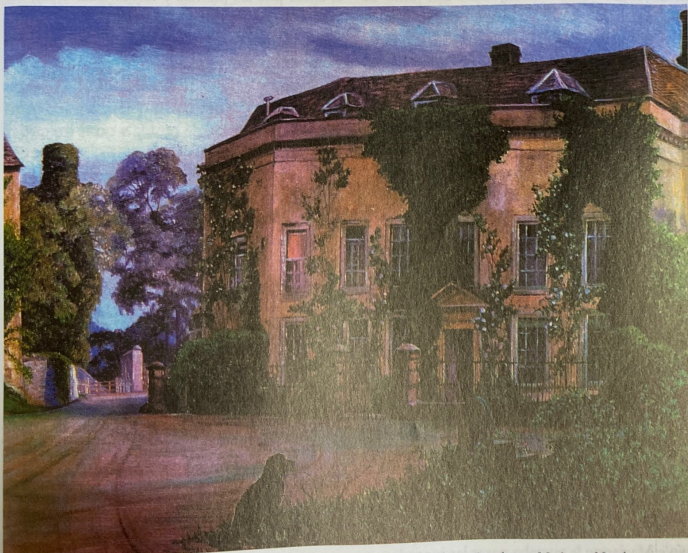
Mount House, Alderley, Gloucestershire, donde pasó los últimos años de su vida, pintada por Marianne North.

Era a mis ojos el hombre más grande de los vivos, el más entero, también el más generoso y modes-