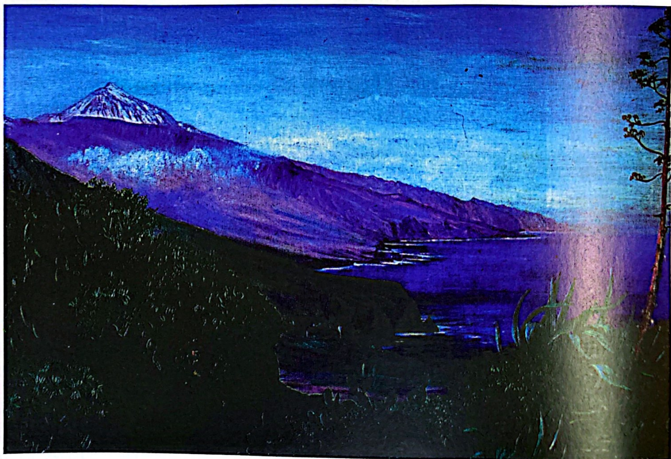
El Teide de Tenerife, Marianne North. Marianne North's Gallery en Kew Gardens. Londres.