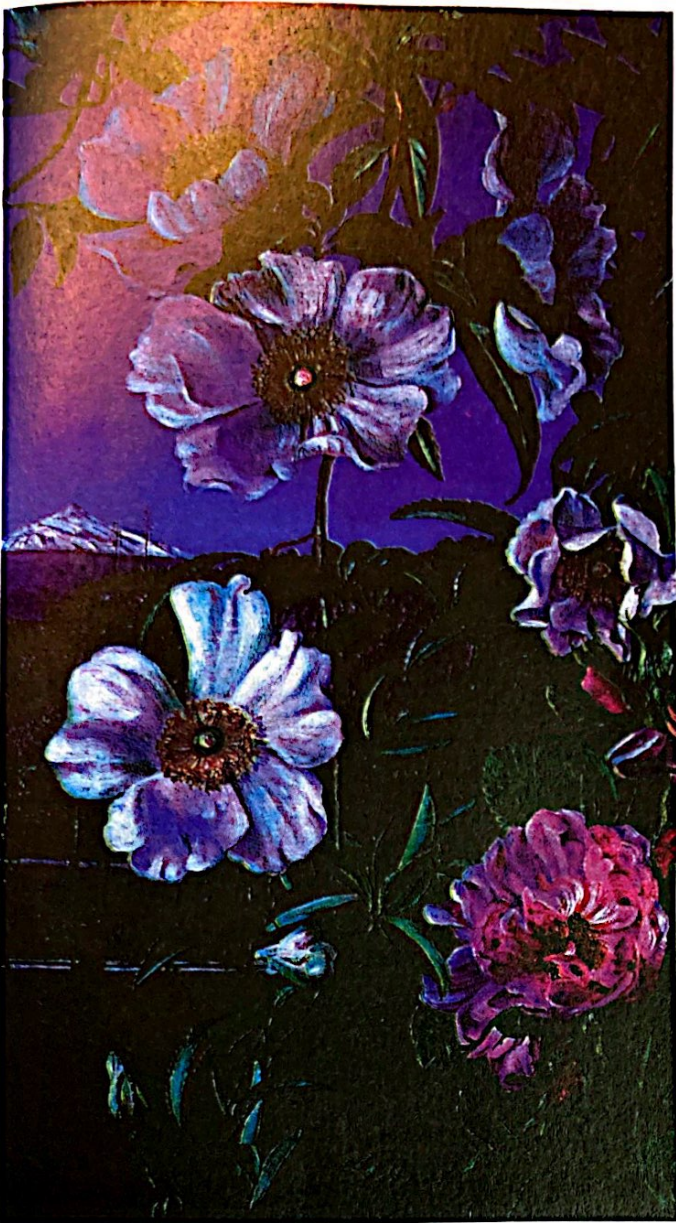
Rosa Cherokee. Marianne North's. Marianne North Gallery en Kew Gardens. Londres.

lado, y aquí Marianne North fue una persona muy afortunada, ya que su casa fue frecuentada por muchos destacados botánicos y naturalistas de la época. Por ejemplo Francis Galton, naturalista y antropólogo importante por sus estudios sobre la inteligencia humana, Sir Edward Sabine, director de la Royal Society de Londres desde 1861 hasta 1871, Sir Joseph Hooker, destacado botánico inglés y director de la misma sociedad hasta 1885, Erskine May, noble intelectual de origen escocés y destacado abogado del Estado, hasta Edward Lear, famoso paisajista y poeta del absurdo, que en una ocasión la llevó, aún joven, a visitar Kew, donde Sir Will-