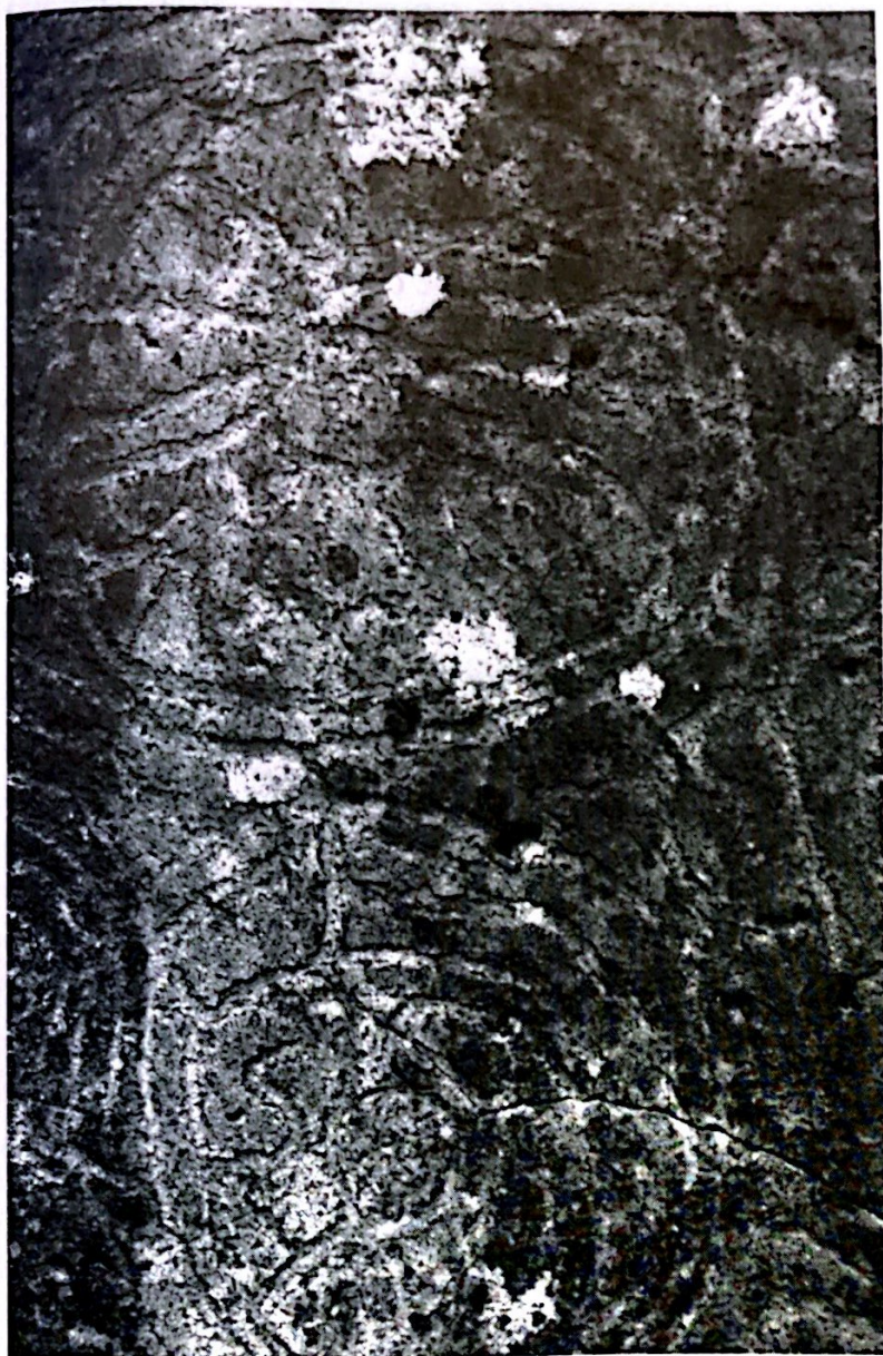
Lomo La Fajana, La Palma.

abundan las representaciones de figuras humanas masculinas (antropomorfos) y esquemáticas vulvas femeninas o triángulos púbicos en el complejo ceremonial de Risco Chapín (Cuevas del Caballero, Cueva del Cagarrutal y Cueva de Los Candiles) vinculados a cultos de fecundidad. Otros motivos antropomorfos en Aripe (Tenerife) y Cabezo del Charco Viejo (La Gomera), son descubiertos recientemente. Escasas son las representaciones de animales (zoo-morfos) como los supuestos lagartos y los encuadrados de época postconquista caballos con jinetes de Balos. En la Montaña de Tindaya (Fuerteventura) se grabaron cientos de figuras de pies humanos (podomorfos) que también