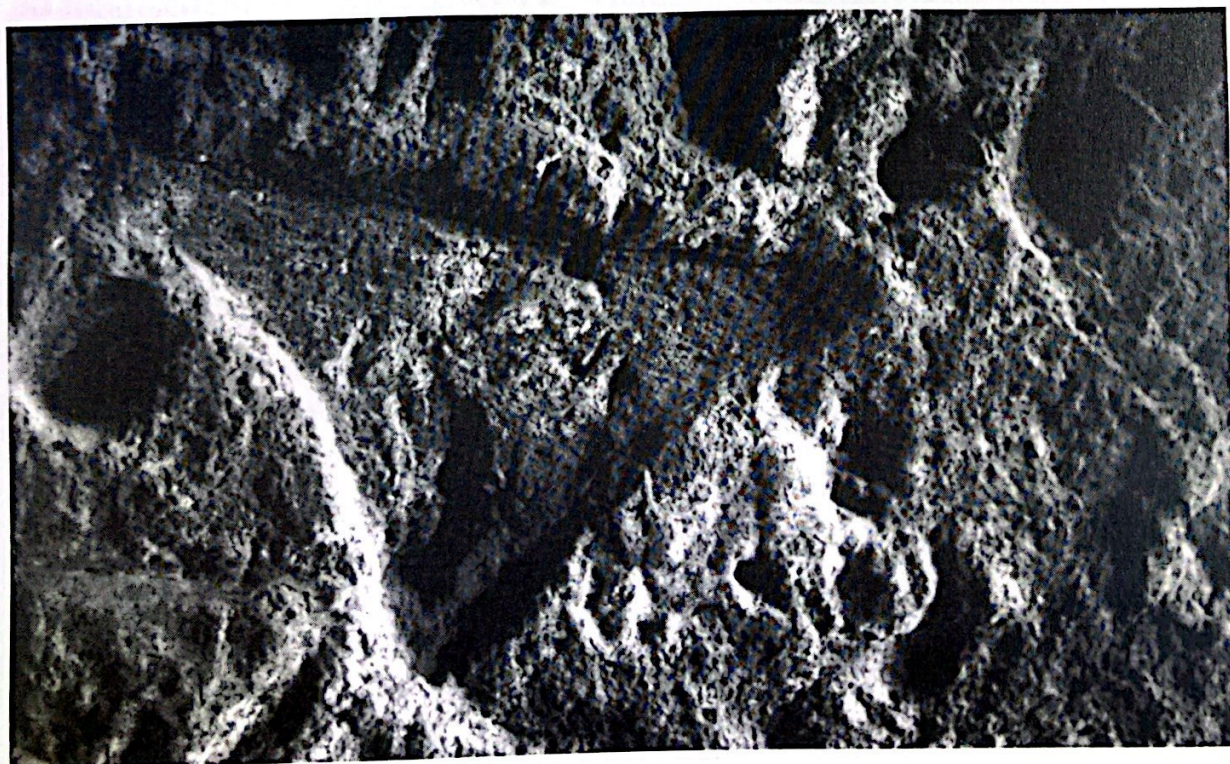
Los Candiles, Gran Canaria

por el pasado de estas islas. La investigación plantea grandes interrogantes en relación, al momento de arribada de los primeros habitantes y los posteriores asentamientos de población en cada una de las islas del Archipiélago Canario. Especialistas en cada área de estudio, tras muchos años de dedicación, van aportando datos que permiten ir despejando algunos