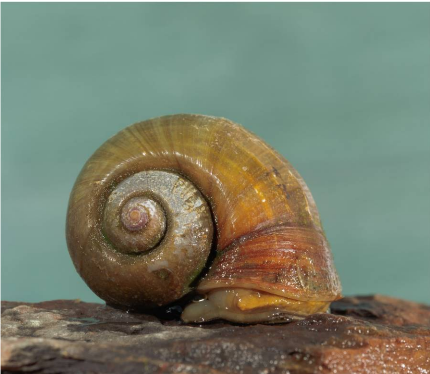
Fig. 6. Caracol manzana, Pomacea sp.

cotorra argentina, que compite con aves nativas o el caracol manzana (Fig. 6) y el cangrejo de río americano, que causa importantes destrozos en las infraestructuras hidráulicas o el picudo rojo, un gorgojo que produce significativos perjuicios en las palmeras canarias, son una amenaza importante para el equilibrio de los ecosistemas. Una de las últimas de las invasoras en incorporarse a esta triste lista es la tilapia de Mozambique, que ha colonizado la Charca de Maspalomas hasta arrasar con las once especies de peces citadas para esta masa de agua, ha devorado toda la vegetación subacuática y con riesgo de que acaben depredando sobre los polluelos de las aves acuáticas.