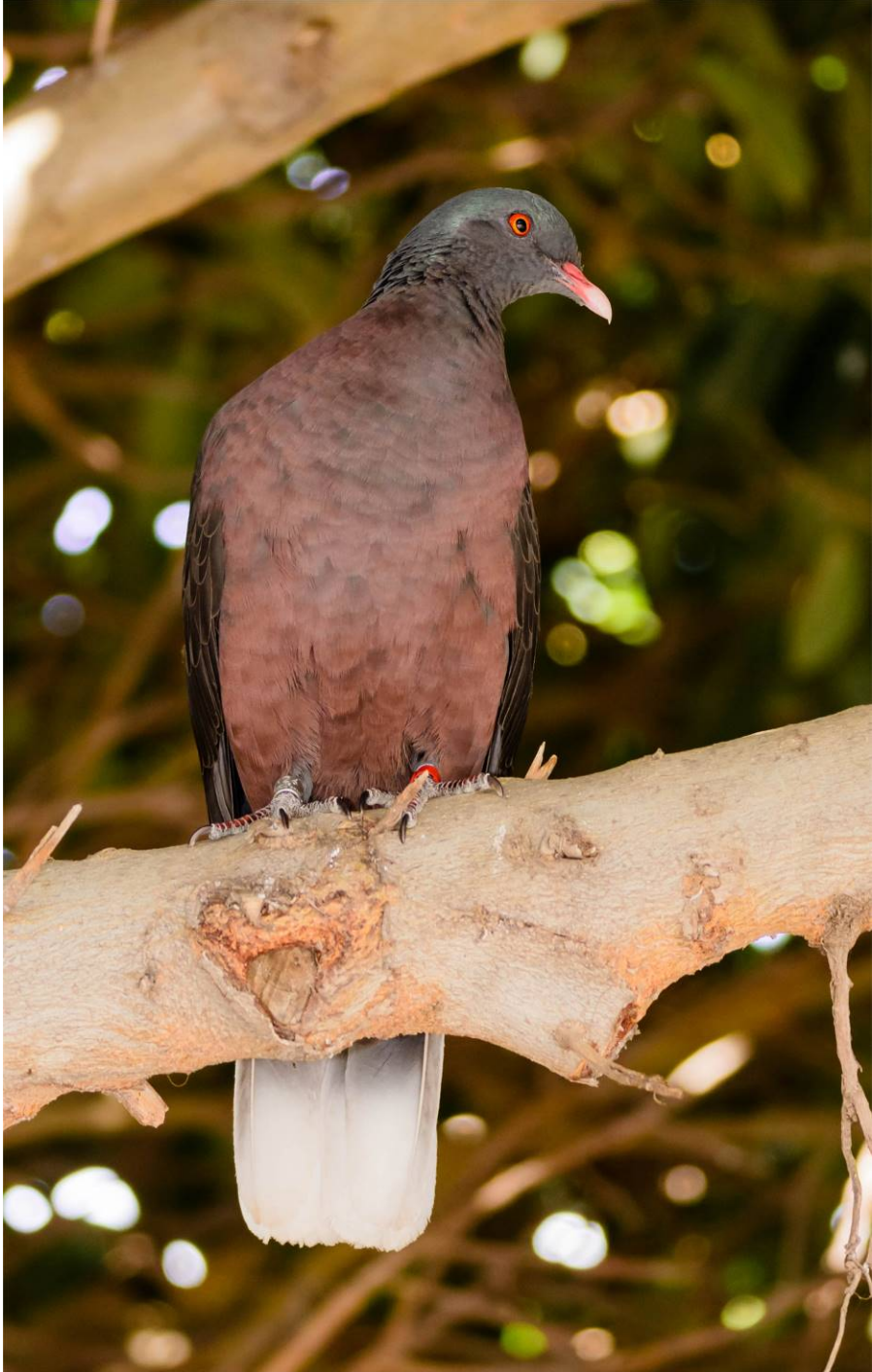
Fig. 5. Paloma rabiche, Columba junoniae .