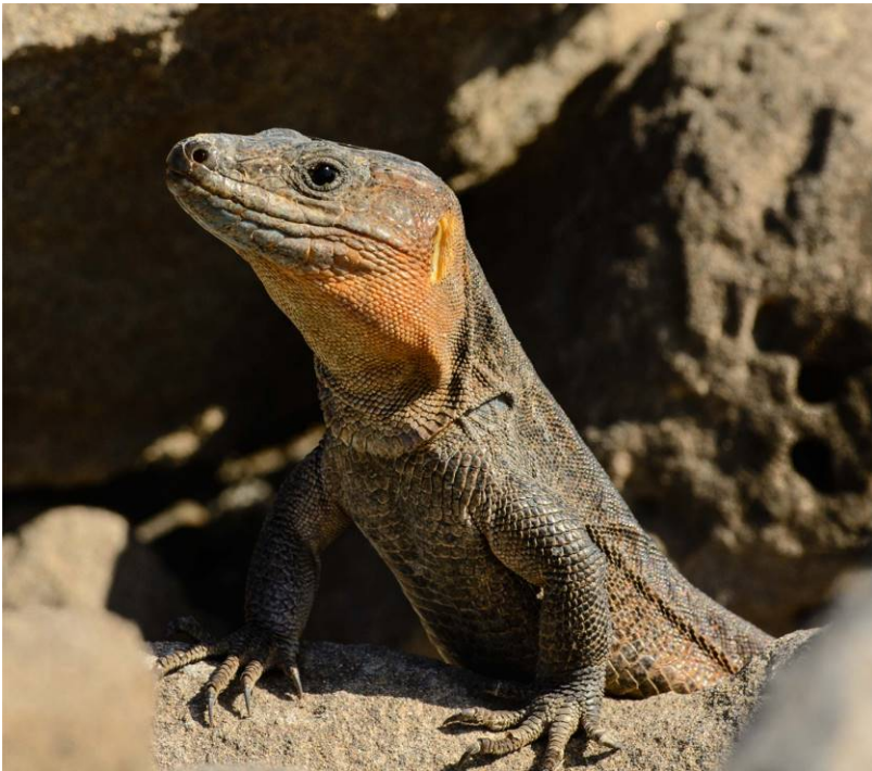
Fig. 2. Lagarto gigante de Gran Canaria, Gallotia sthelinii .

El lagarto gigante de Gran Canaria (Fig. 2) pertenece al grupo de los «lagartos gigantes» de Canarias pues puede alcanzar los 80 cm de longitud, aunque lo habitual es que no supere los 45; y sin embargo, hasta ahora es una especie abundante. Se distribuye prácticamente por toda la isla. Juega un importante papel en la trama ecológica de la isla gracias a que es un gran dispersor de semillas de plantas, aunque no desdeña los insectos en ciertas etapas de su vida. Como la mayoría de los lagartos, aprovecha las primeras horas del día para elevar su temperatura corporal exponiéndose a la radiación solar. La reciente introducción de la culebra real de California ( Lampropeltis getula californae ) está poniendo en serio peligro sus poblaciones y comprometiendo a medio plazo la viabilidad de la especie.