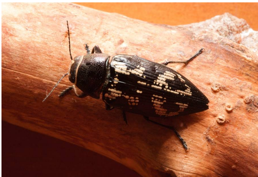
Fig. 1. Escarabajo Buprestis bertheloti .

A estas fortalezas de los hábitats potenciales habría que sustraerle las transformaciones históricas que empezaron a sufrir las islas con la colonización y especialmente con la introducción del ganado. Pero si hay un hito en la historia de la conservación de Canarias es su colonización por los europeos, que a los habituales aprovechamientos forestales y agrícolas, dejaron un sistema de reparto de tierras muy fragmentado que favorecía el minifundio y la explotación intensiva de sus recursos naturales. A esto hay que añadir la importante deforestación durante la Guerra Civil española y la postguerra, especialmente para el carboneo. El asentamiento de la población en la zona del bosque termófilo, el aprovechamiento agrícola de la laurisilva, el maderero del pinar y el abancalamiento de todos los terrenos en pendiente se culminó con el desarrollo de la industria turística que urbanizó los territorios costeros que habían escapado a la ocupación humana.