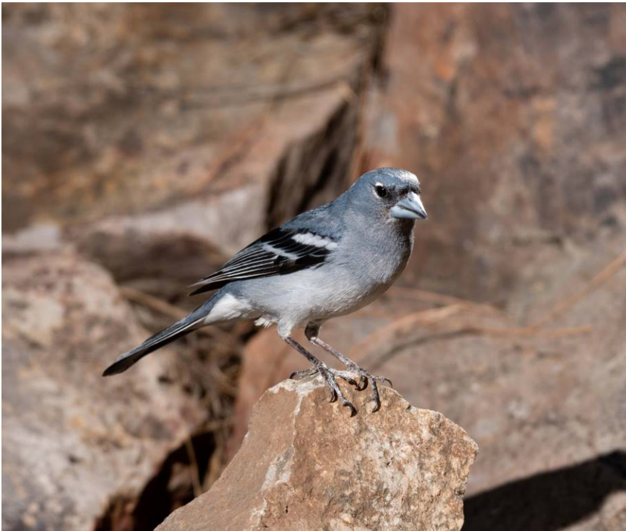
Fig. 4. Pinzul o pinzón azul de Gran Canaria, Fringilla polatzeki .

Es una de las aves más escasas de Europa, por eso está dentro de la máxima categoría de protección en la Directiva Aves, en peligro de extinción dentro del Catálogo Nacional de Especies Amenazadas y en el Catálogo Canario y en el Anexo II (fauna estrictamente protegida) del Convenio de Berna.