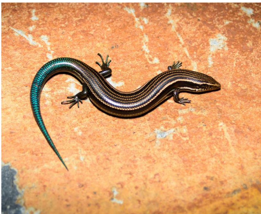
Fig. 3. Lisa de Gran Canaria, Chalcides sexlineatus .

Está bajo el «régimen de protección especial» del Catálogo Nacional de Especies Amenazadas y en el Catálogo Canario.