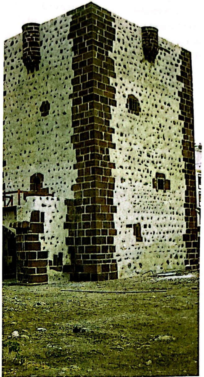
La Torre del Conde, en San Sebastián de la Gomera

El fantasma del hambre que invadió la vida de los primeros tiempos de La Isabela se había generado por la mala adaptación de algunos animales y la falta de germinación de los cereales, así como por la dificultad de los colonos para acostumbrarse a comer los nuevos alimentos de la isla, a los que tampoco tenían fácil acceso por la actitud beligerante de los indios. Estos problemas de alimentación sufridos por los castellanos en los primeros meses de vida aquí han de explicarse no sólo por la caren-