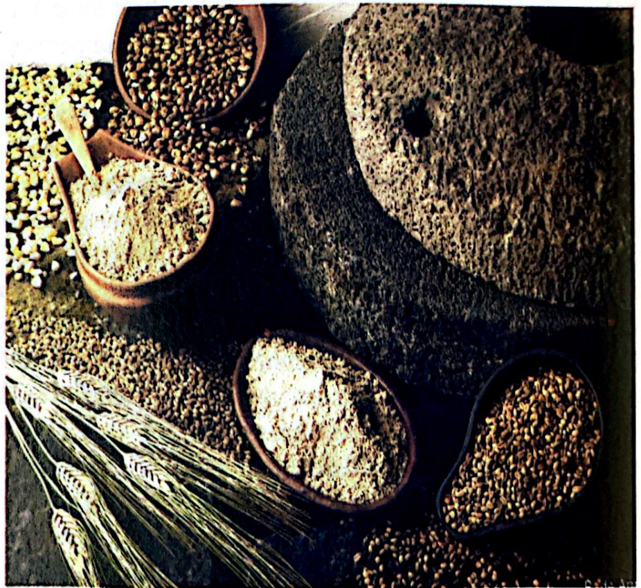
El gofio, alimento llevado desde Canarias a las Antillas

El texto de Bartolomé de Las Casas sobre el Segundo Viaje, el Memorial a los Reyes de Cristóbal Colón, como otros relativos a esta Expedición, confirman el embarque en el puerto gomero de un buen número de animales, en parejas y preñados, a manera de “una pequeña arca de Noé”, que más tarde se reproducirían en las nuevas tierras para asegurarse el consumo de la