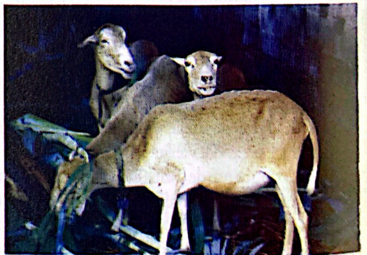
Oveja de pelo. Especie antigua de África y de Canarias adaptada hoy a las islas antillanas

Por su parte, Gran Canaria ya había sido incorporada a la Corona de Castilla desde el final de la conquista, en 1484, pero los dos puertos principales con los que se podía contar, el de "Las Isletas", situado a