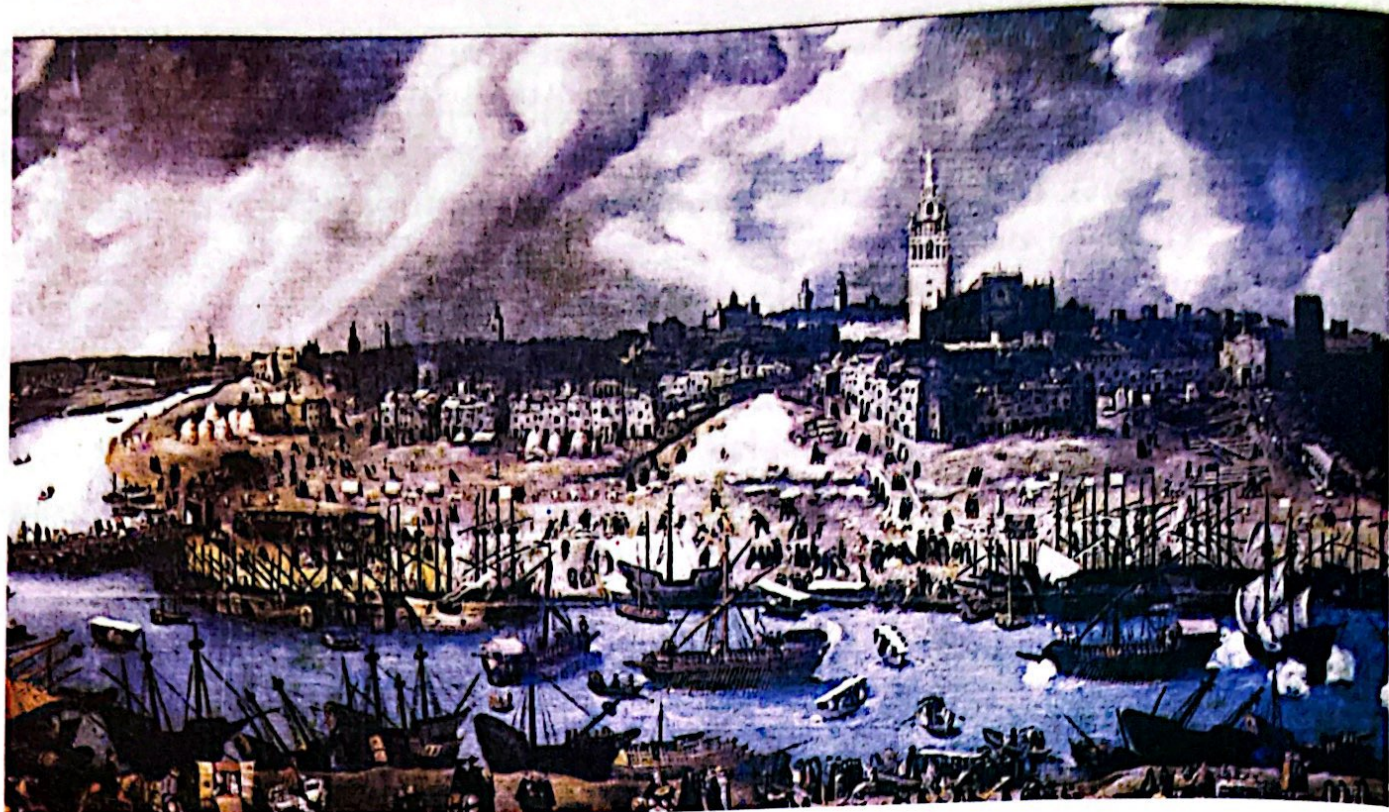
El puerto de Sevilla durante el siglo XVII

en esta isla en donde habrían de embarcarse estas viandas que servían de “refresco” a los colonos de La Isabela. La estima de su calidad explica el interés del Almirante por proveerse en el puerto gomero de este producto, pero también la predilección que Cristóbal Colón sentía por ellos, ya que él mismo había comerciado con quesos a lo largo de la costa Ligur, además de con lana, vino y otras mercancías 40 .