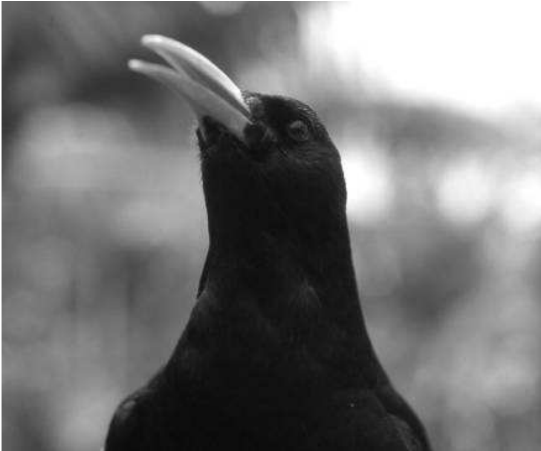
Fig. 5. Chova piquirroja ( Pyrhacorax pyrrhacorax ).

Según Lorenzo (2007) son los vertebrados más abundantes con un total de 52 especies nidificantes. En la Tabla 1 se relacionan todas las aves presentes en la isla reflejando, además, el grado de amenaza en el que se encuentran. De esta relación, el mosquitero canario ( Phylloscopus canariensis ), la paloma turqué ( Columba bollii ) y la paloma rabiche ( C. junoniae ), son endémicas de Canarias, mientras que el pinzón vulgar ( Fringilla coelebs palmae ) y el herrerillo común ( Cyanistes teneriffae palmensis ) son endemismos insulares a nivel de subespecie. Como ave exclusiva y símbolo faunístico de La Palma está la chova piquirroja o graja ( Pyrhacorax pyrrhacorax ) (Fig. 5) cuyas poblaciones en el pasado ocupaban otras islas como La Gomera, Tenerife y, probablemente, El Hierro (Martín & Lorenzo, 2001). La población actual estaría conformada por unas 3000 aves (G. Blanco, com. pers.). Igualmente, la paloma rabiche también ha tenido un protagonismo particular en los últimos años gracias a un programa de reintroducción de esta especie en la isla de Gran Canaria, donde ha llegado a reproducirse y establecer poblaciones naturales ( www.liferabiche.com ).