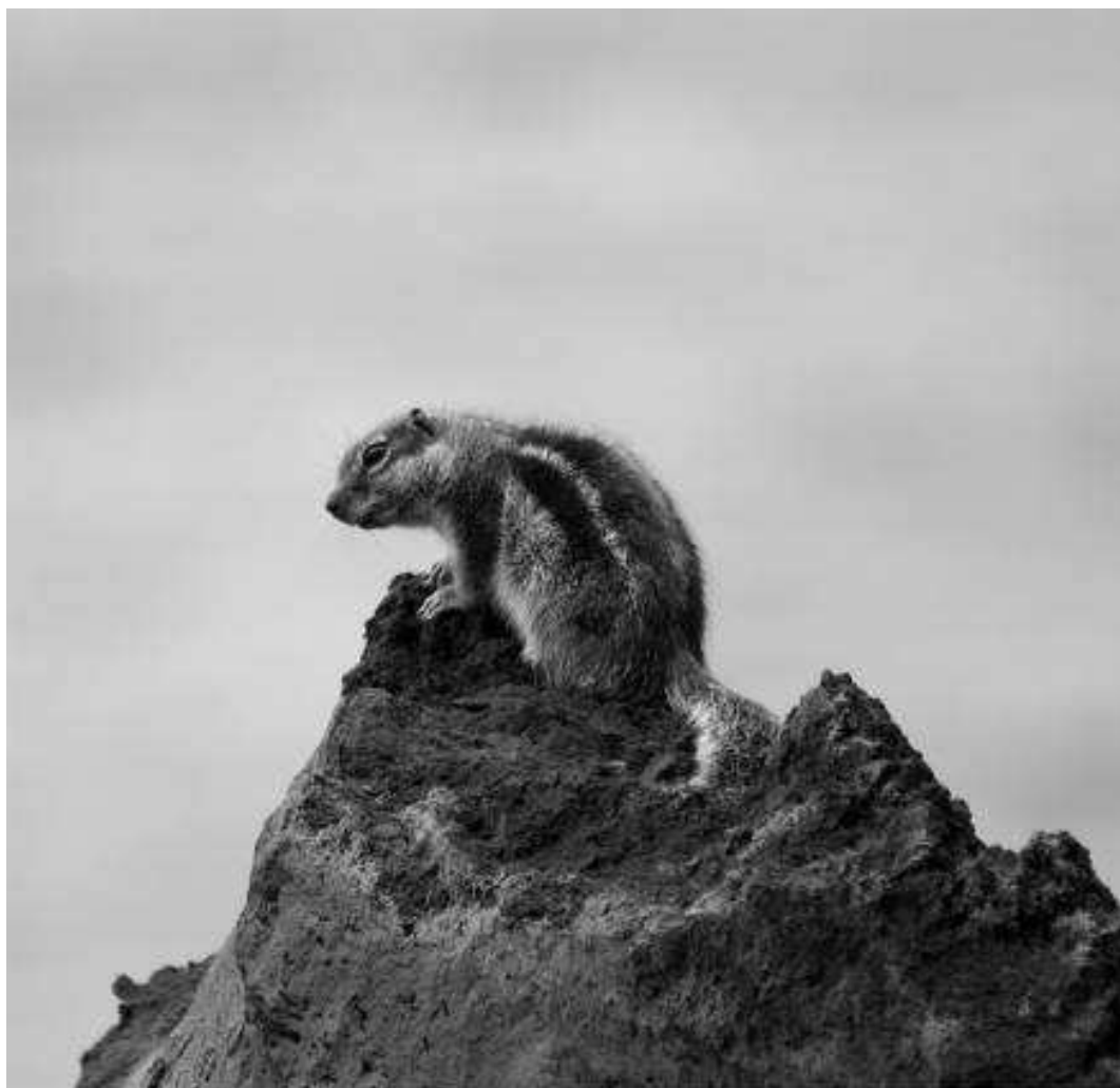
Fig. 12. Ejemplar de ardilla moruna ( Atlantoxerus getulus ) en la localidad de Lomada Grande (Garafía) en la isla de La Palma.

y después de 25 horas de trampeo efectivo, el ejemplar, una hembra, fue capturada. De esta manera se evitó una naturalización de esta especie en la isla donde existe un hábitat adecuado para el desarrollo de todo su ciclo biológico (López-Darias et al. , 2008), un gran riesgo para la conservación de la biodiversidad en este archipiélago (Nogales et al. , 2006).