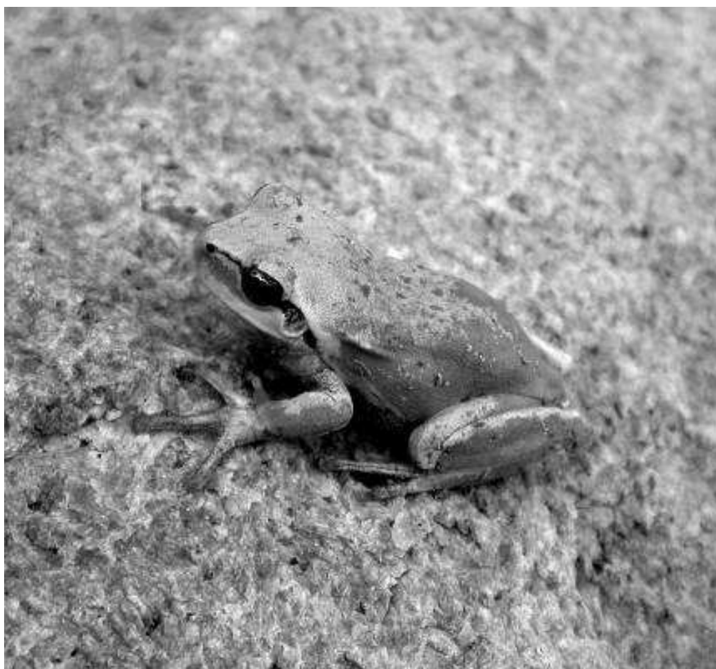
Fig. 2. Ranita meridional ( Hyla meridionalis ).

básicamente de insectos. A partir de estos hábitats antropizados, sus poblaciones se han ido naturalizando y en la actualidad es frecuente verlas en el medio natural como, por ejemplo, en buena parte del Barranco de las Angustias, principal vía de entrada al Parque Nacional de la Caldera de Taburiente. Ambas ranas tienen costumbres diferentes; la ranita meridional (Fig. 2) vive sobre todo asociada a la vegetación de ribera de los barrancos y corrientes de agua (Tejedo & Reques, 2004), adhiriéndose a ella gracias a unas ventosas que poseen en las terminaciones de sus dedos. Por su parte, la rana común es de hábitos más acuáticos y carece de ventosas, viviendo más directamente en contacto con el agua (Egea-Serrano, 2014).