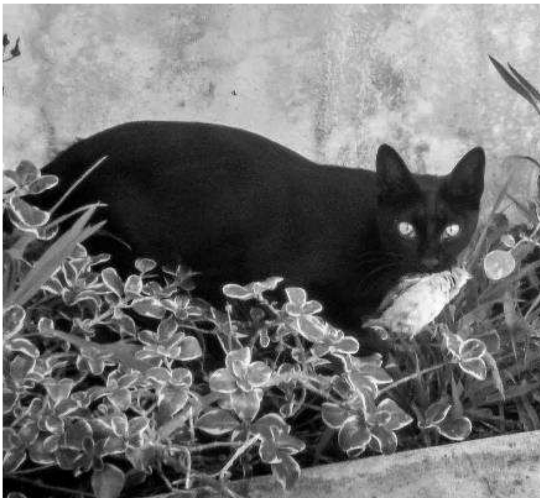
Fig. 11. Gato doméstico ( Felis silvestris catus ).

otros mamíferos introducidos (conejos, ratas y ratones) su principal presa, tanto a nivel de frecuencia de aparición en sus excretas como en porcentaje de biomasa consumida (Nogales & Medina, 2009). No obstante, también incluye especies nativas de aves, reptiles e invertebrados, algunos de ellos amenazados como pueden ser los lagartos gigantes de Canarias ( Gallotia intermedia , G. bravoana y G. simonyi ), el pinzul ( Fringilla teydea polatzeki ), o la tarabilla canaria ( Saxicola dacotiae ) (Medina & Nogales, 2009).