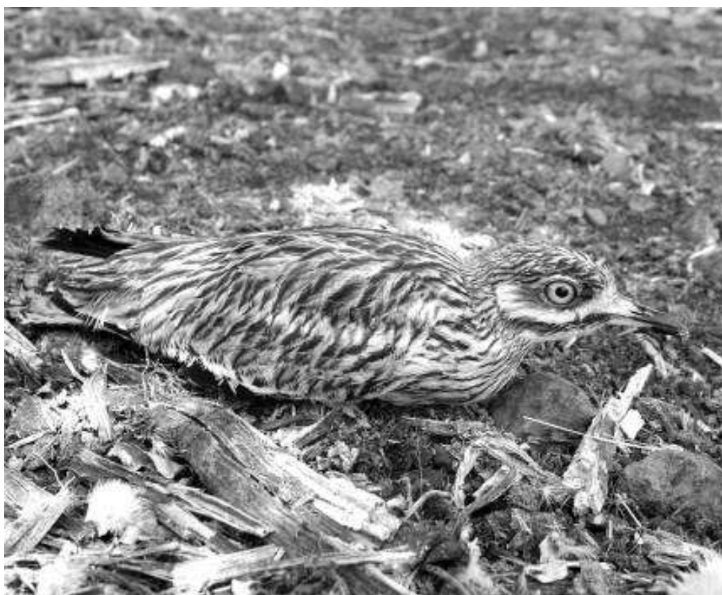
Fig. 6. Alcaraván común ( Burhinus oedicephalus distinctus ) una de las especies en declive en La Palma.

Un interesante estudio sobre las aves de La Palma, analiza la abundancia y distribución de las especies terrestres diurnas en los distintos ecosistemas (Carrascal et al. , 2008). Los principales resultados de este trabajo resaltan que muchas de las aves están muy bien distribuidas en toda la isla, siendo las más abundantes el mosquitero canario, el mirlo común ( Turdus merula ), el canario ( Serinus canarius ) y el capirote ( Sylvia atricapilla ). Por el contrario, entre las especies más raras o menos frecuentes estarían la curruca tomillera ( Sylvia conspicillata ), el pardillo ( Carduelis cannabina ), el gavián común ( Accipiter nisus ), la choca perdiz ( Scolopax rusticola ), la codorniz común ( Coturnix coturnix ), el alcaraván común ( Burhinus oedicephalus ) (Fig. 6) o el gorrión moruno ( Passer hispaniolensis ) (Carrascal et al. , 2008). En cuanto a la distribución de las especies en los distintos hábitats, estos autores comentan que la menor diversidad se encuentra en el matorral de alta montaña, mientras que las medianías de la isla, con cultivos y casas dispersas, constituirían el hábitat con una mayor riqueza de especies. Por su parte, las zonas con mayor densidad de aves estarían en la laurisilva y el fayal-brezal y las de menor densidad en la alta montaña y las coladas volcánicas recientes (Carrascal et al. , 2008).