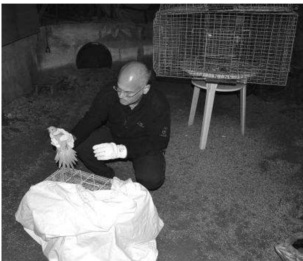
Fig. 10. Captura de un ejemplar de cotorra de Kramer ( Psittacula krameri ) en la isla de La Palma durante la campaña de control de esta especie exótica invasora desarrollada por el Cabildo Insular de La Palma.

Los primeros ejemplares asilvestrados, escapados de cautividad, se observaron en la zona de Las Breñas a partir del año 1997. Ante la posibilidad de su expansión en la isla, los conservacionistas dieron la voz de alarma haciéndose caso omiso a sus avisos. No es hasta 2015, debido a los problemas causados en la agricultura, cuando se toma la decisión de llevar a cabo su control. En un censo inicial se estima la población en un máximo de 70 ejemplares distribuidos en dos localidades, la principal en Las Breñas, compuesta por unas 60 aves y una secundaria de unos 10 individuos en la zona de La Laguna en Los Llanos de Aridane. En una primera campaña llevada a cabo en 2016 se capturaron, mediante trampas de captura en vivo, un total de 116 ejemplares, más de los censados debido a que pudieron reproducirse durante el periodo que duró la actividad (Fig. 10). Posteriormente, en 2018, se han capturado otras 33 cotorras. En la actualidad se han dado por controladas sus poblaciones en el medio natural, al no haberse constatado su presencia desde el mes de abril de ese mismo año. No obstante, se han detectado aves mantenidas en cautividad como mascotas por lo que se deberán extremar las precauciones y realizar nuevos seguimientos con el fin de detectar nuevos escapes.