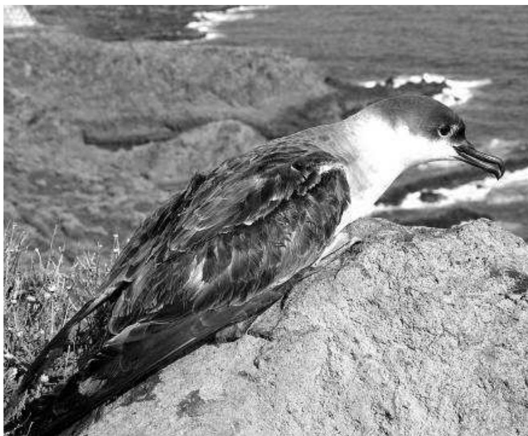
Fig. 9. Ejemplar de pardela capirotada ( Puffinus gravis ), una de las especies migratorias llegadas a La Palma y atendidas en el Centro de Rehabilitación de Fauna Silvestre dependiente del Cabildo Insular de La Palma.

Algunas aves marinas visitan La Palma como migrantes y su presencia ha sido constatada en varias ocasiones como pueden ser los casos de la pardela capirotada ( Puffinus gravis ) (Fig. 9), la pardela sombría ( Puffinus griseus ), el paño pechialbo ( Pelagodroma marina ), el paño de Leach ( Oceanodroma leucorhoa ), el paño común ( Hydrobates pelagicus ), la gaviota de Audouin ( Larus audouinii ) o la gaviota tridáctila ( Rissa tridactyla ) (ver Medina, 2014).