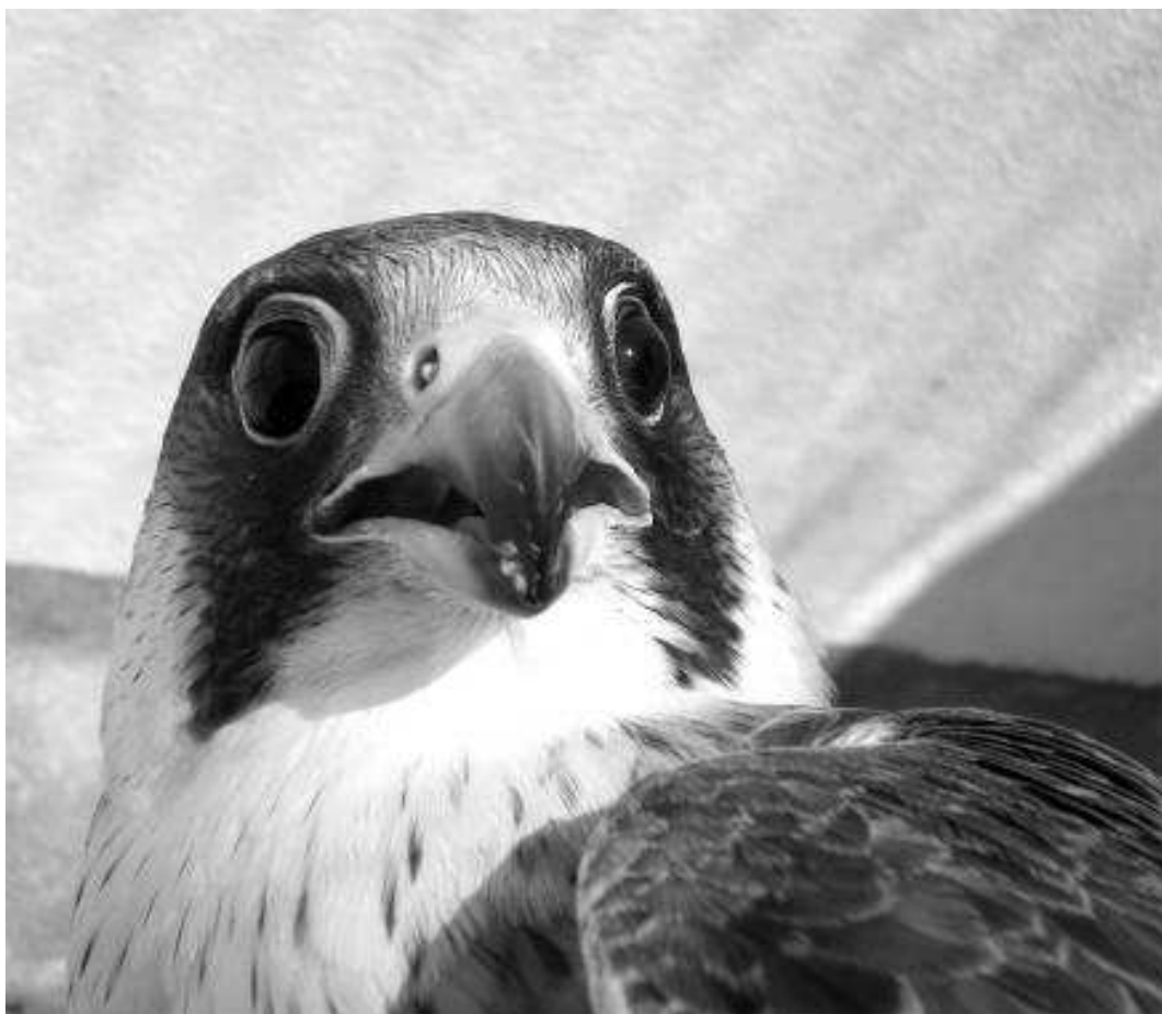
Fig. 7. Halcón de Berbería ( Falco [peregrinus] pelegrinoides ).

Otras aves rapaces, tanto diurnas como nocturnas, presentes en La Palma son el cernícalo vulgar ( Falco tinnunculus ), el búho chico ( Asio otus ) (Fig. 8), la aguililla ( Buteo buteo ) y el ya mencionado gavián común.