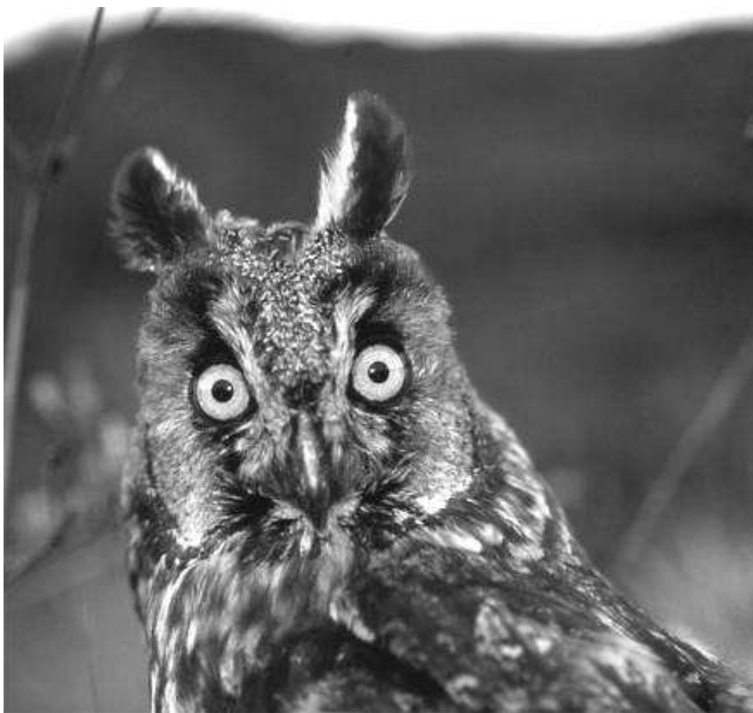
Fig. 8. Búho chico ( Asio otus ).

pichoneta, la pardela chica, el petrel de Bulwer ( Bulweria bulwerii ) y el paño de Madeira. Estas especies son mucho más escasas que la pardela cenicienta con aproximadamente 200, 50 y 100 parejas nidificantes, respectivamente; respecto al paño de Madeira, a penas se tienen sospechas de su nidificación en los roques del norte de La Palma (Martín & Lorenzo, 2001). La pardela pichoneta posee prácticamente la totalidad de la población canaria en esta isla y se caracteriza porque, a pesar de ser un ave marina, a diferencia de sus congéneres nidifica en los acantilados y laderas del interior del bosque de laurisilva.