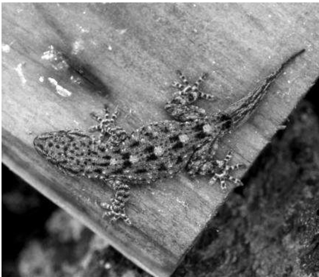
Fig. 3. Perenquén de Delalande ( Tarentola delalandii ).

Las rañas han sido muy poco estudiadas en Canarias. Se trata de un reptil de hábitos nocturnos y crepusculares, aunque con cierta actividad diurna, con una dieta insectívora en la que incluye otros invertebrados como arañas e isópodos terrestres (Salvador, 2015). Se distribuye por toda la isla siendo muy frecuente en zonas antropizadas.