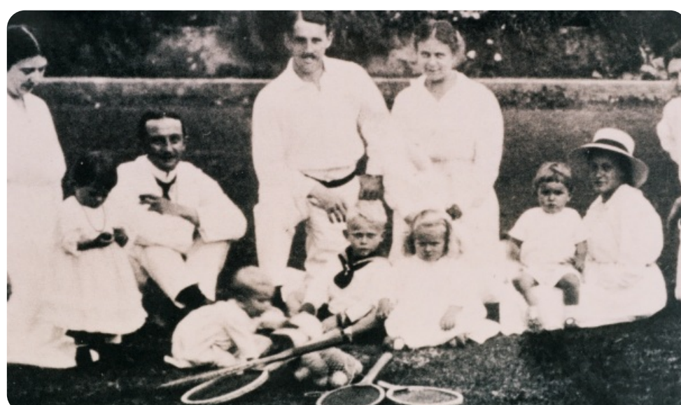
Familia Wolfgang Köhler