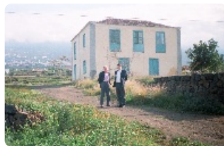
La Casa Amarilla