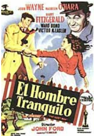
Proyección de la película "El hombre tranquilo" (1952), del director John Ford