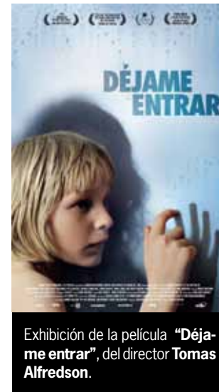
Exhibición de la película "Déjame entrar", del director Tomas Alfredson.

Basada en la novela homónima de John Ajvide Lindqvist, la película resulta un drama fantástico que nos presenta la amistad entre un niño lleno de problemas y una niña vampiro, todo ello relatado con romanticismo, poesía y ternura, en un ambiente de oscuridad en un suburbio de Estocolmo durante los años 80. El filme ha recibido numerosos elogios de la crítica internacional y una treintena de premios en diversos festivales; entre otros: el Premio Méliès de Oro a la Mejor Película Europea en el Festival de Sitges 2008, el Premio del Público a la Mejor Película en la Semana de Cine Fantástico de San Sebastián 2008, el Premio del Público al Mejor Director y el Premio Junta de Andalucía al Mejor Largometraje en el Festival de Cine Fantástico de Málaga Fancine 2008.